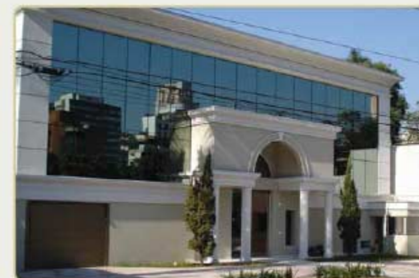
SEDE DA EZTEC