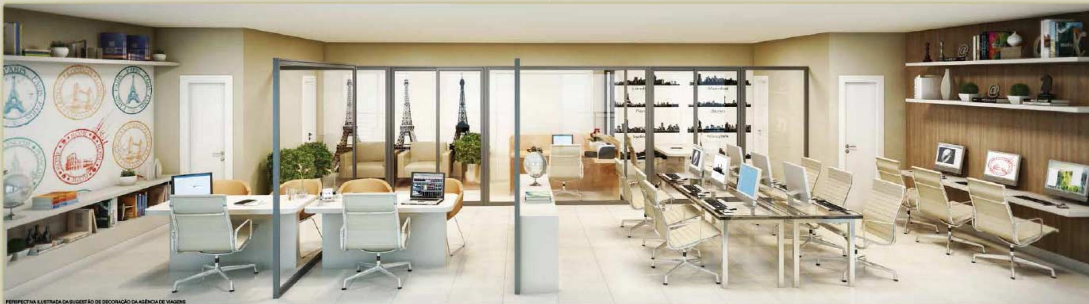
PERSPECTIVA ILUSTRADA DA SUGESTÃO DE DECORAÇÃO DA AGÊNCIA DE VIAGENS

Salas que permitem fácil circulação, formando ambientes dinâmicos que proporcionam conforto e melhor produtividade, são fundamentais para os desafios do mundo dos negócios.