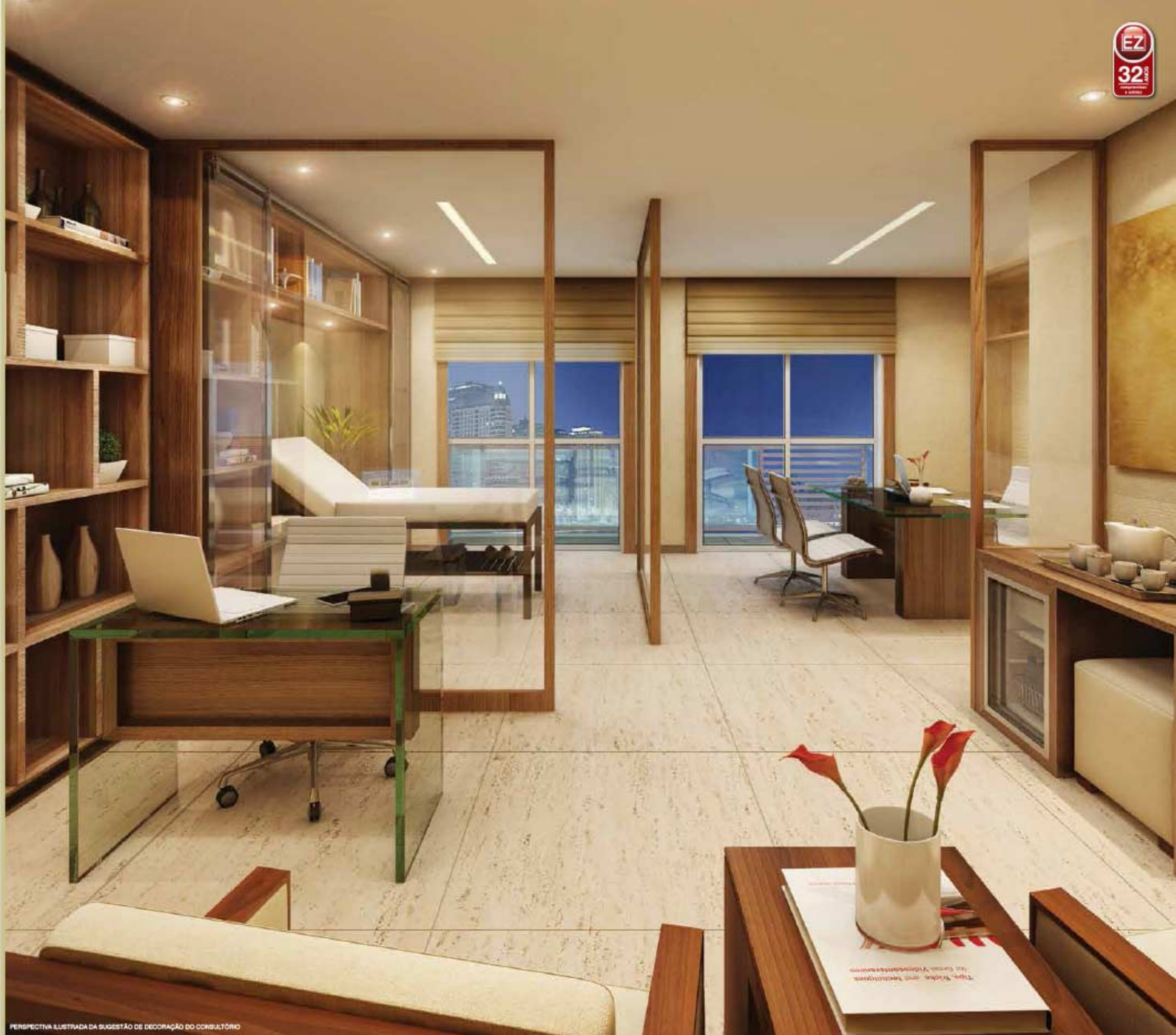
PERSPECTIVA ILUSTRADA DA SUGESTÃO DE DECORAÇÃO DO CONSULTÓRIO