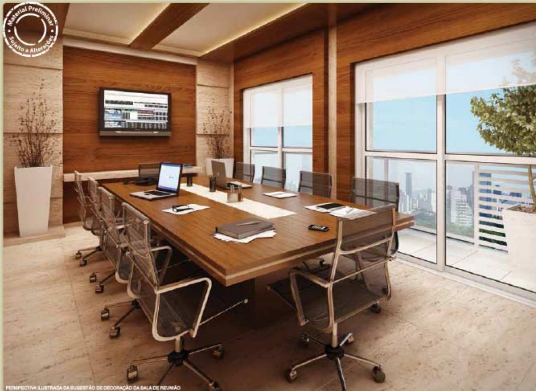
PERSPECTIVA ILUSTRADA DA SUGESTÃO DE DECORAÇÃO DA SALA DE REUNIÃO