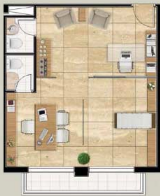
PLANTA COM SUGESTÃO DE DECORAÇÃO DO CONSULTÓRIO

Salas que se adaptam a empresas de diversos segmentos, com ambientes amplos e bem distribuídos prontos para receber a infraestrutura que você e seus clientes necessitam.