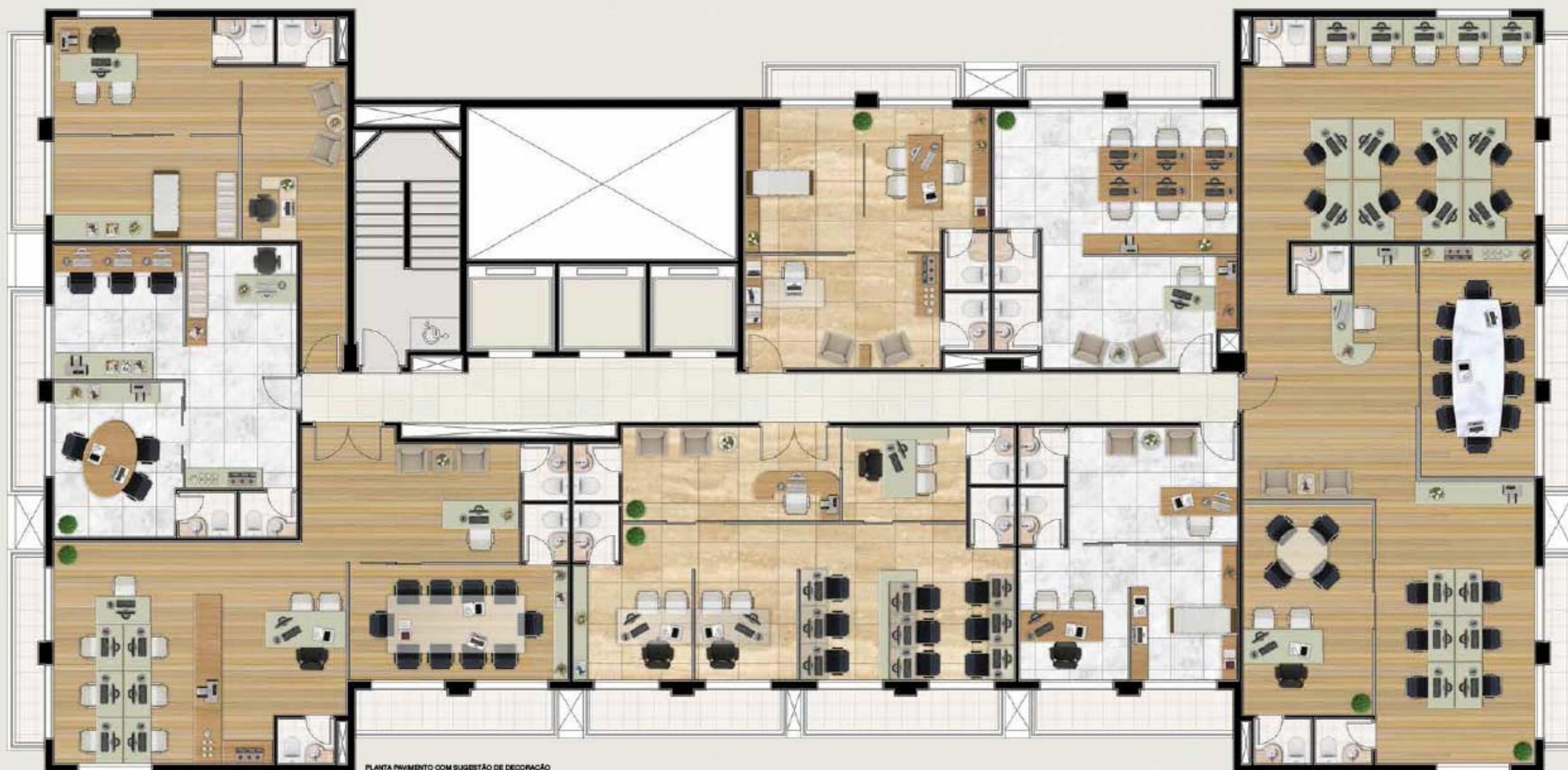
PLANTA PAVIMENTO COM SUGESTÃO DE DECORAÇÃO

Offices preparados para abrigar as mais variadas possibilidades de negócios, sempre com espaços amplos e muito funcionais.