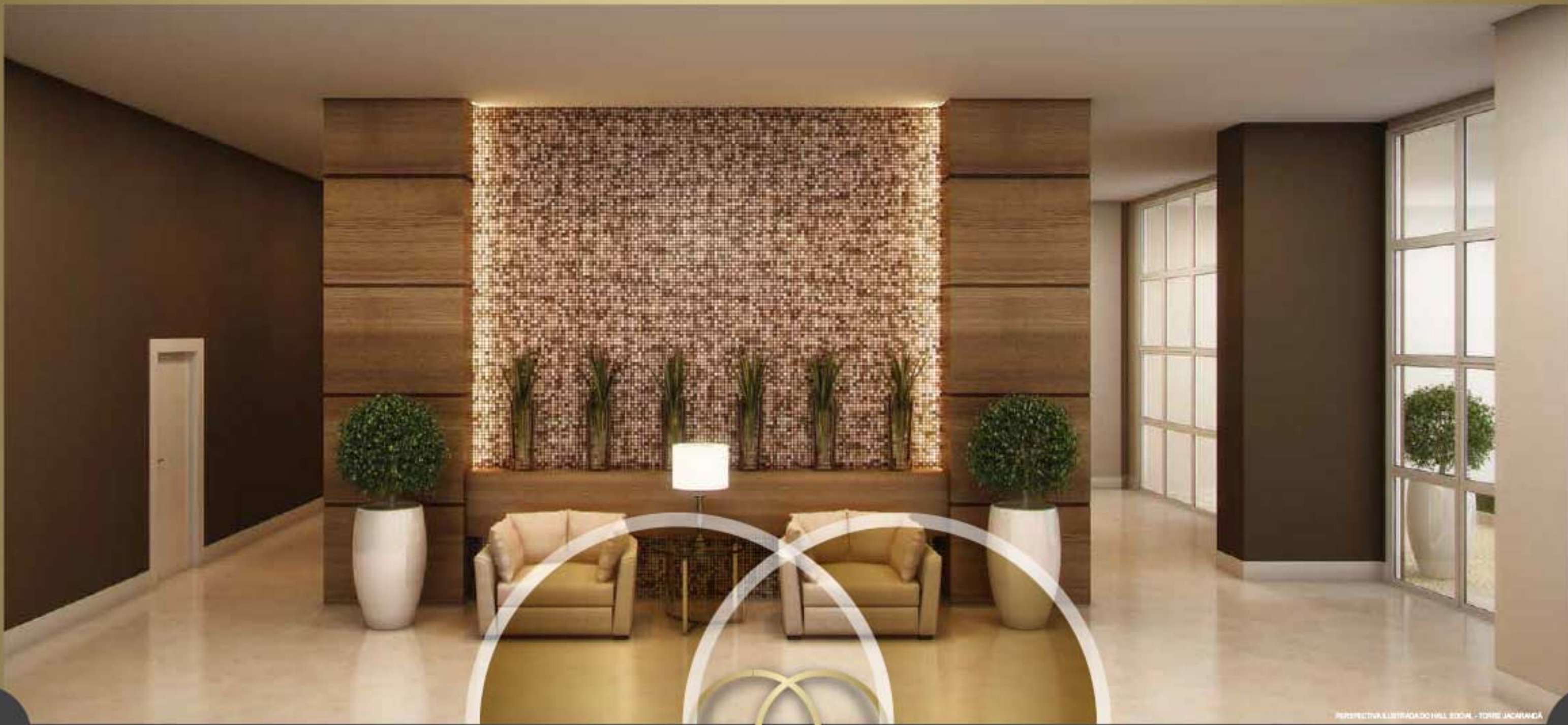
PERSPECTIVA ILUSTRADA DO HALL EDON - TORRE JACARANDA

AMBIENTES REQUINTADOS DÃO AS BOAS-VINDAS DE MANEIRA ÚNICA E SURPREENDENTE.