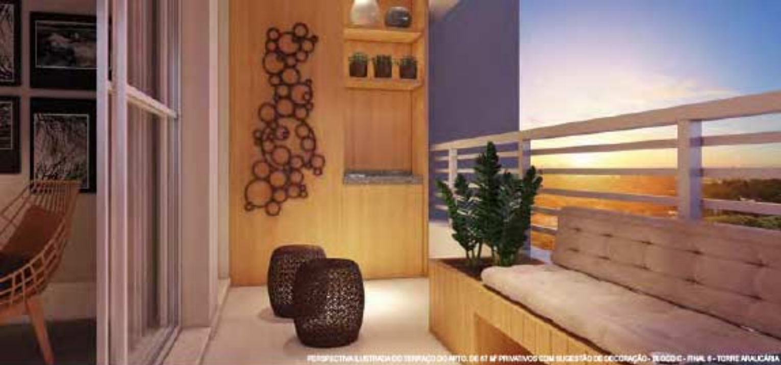
PERSPECTIVA ILUSTRADA DO TERRAÇO DO APTO. DE 87 M 2 PRIVATIVOS COM SUGESTÃO DE DECORAÇÃO - BLOCO C - FINAL 6 - TORRE AVALCÁSA