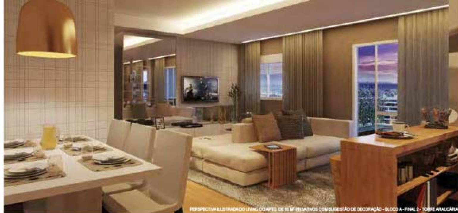
PERSPECTIVA ILUSTRADA DO LIVING DO APTO. DE 83 M 2 PRIVATIVOS COM SUGESTÃO DE DECORAÇÃO - BLOCO A - FINAL 2 - TORRE ARAUCÁRIA

UM LIVING INTEGRADO AO TERRAÇO GARANTE BEM-ESTAR E TRANQUILIDADE PARA SUA FAMÍLIA.