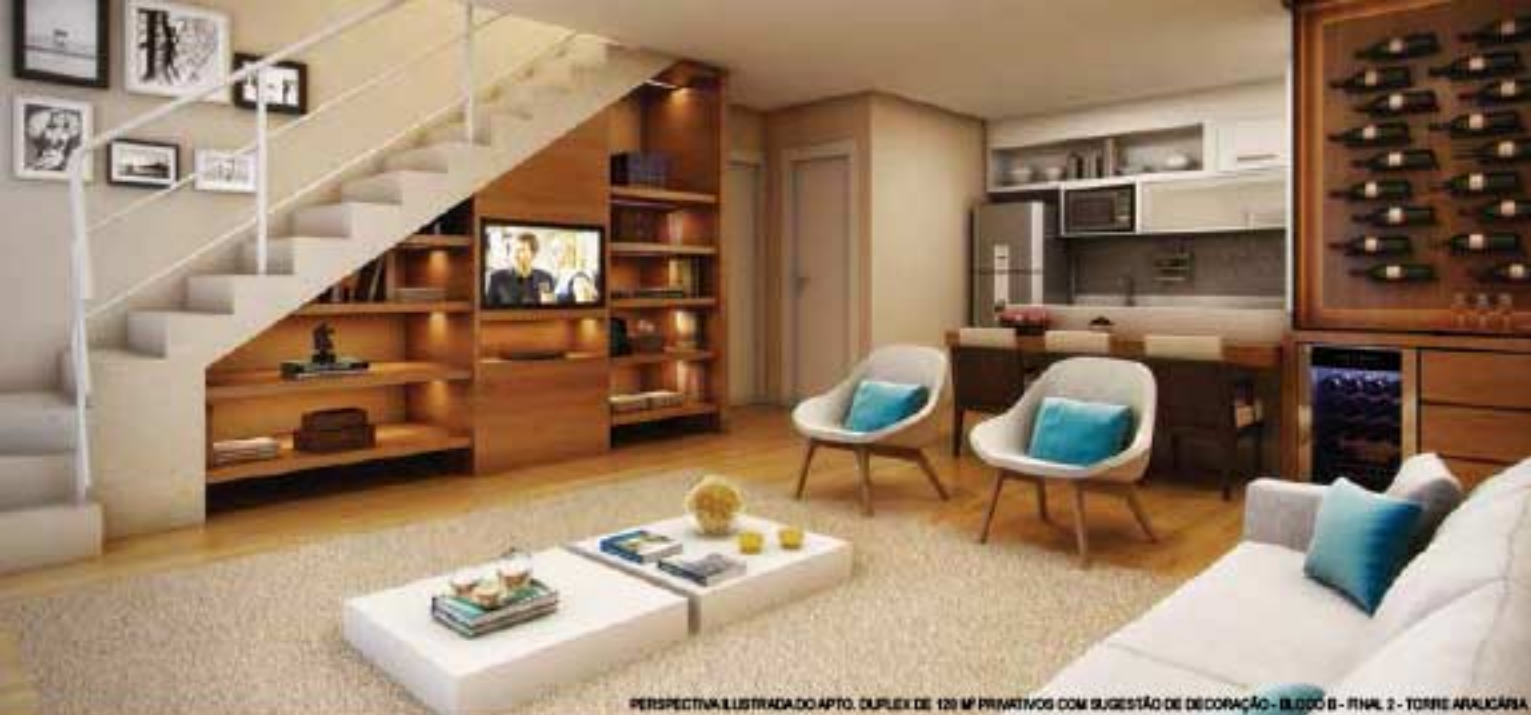
PERSPECTIVA ILUSTRADA DO APTO. DUPLEX DE 120 M 2 PRIVATIVOS COM SUGESTÃO DE DECORAÇÃO - BLOCO B - FINAL 2 - TORRE AVALICASA