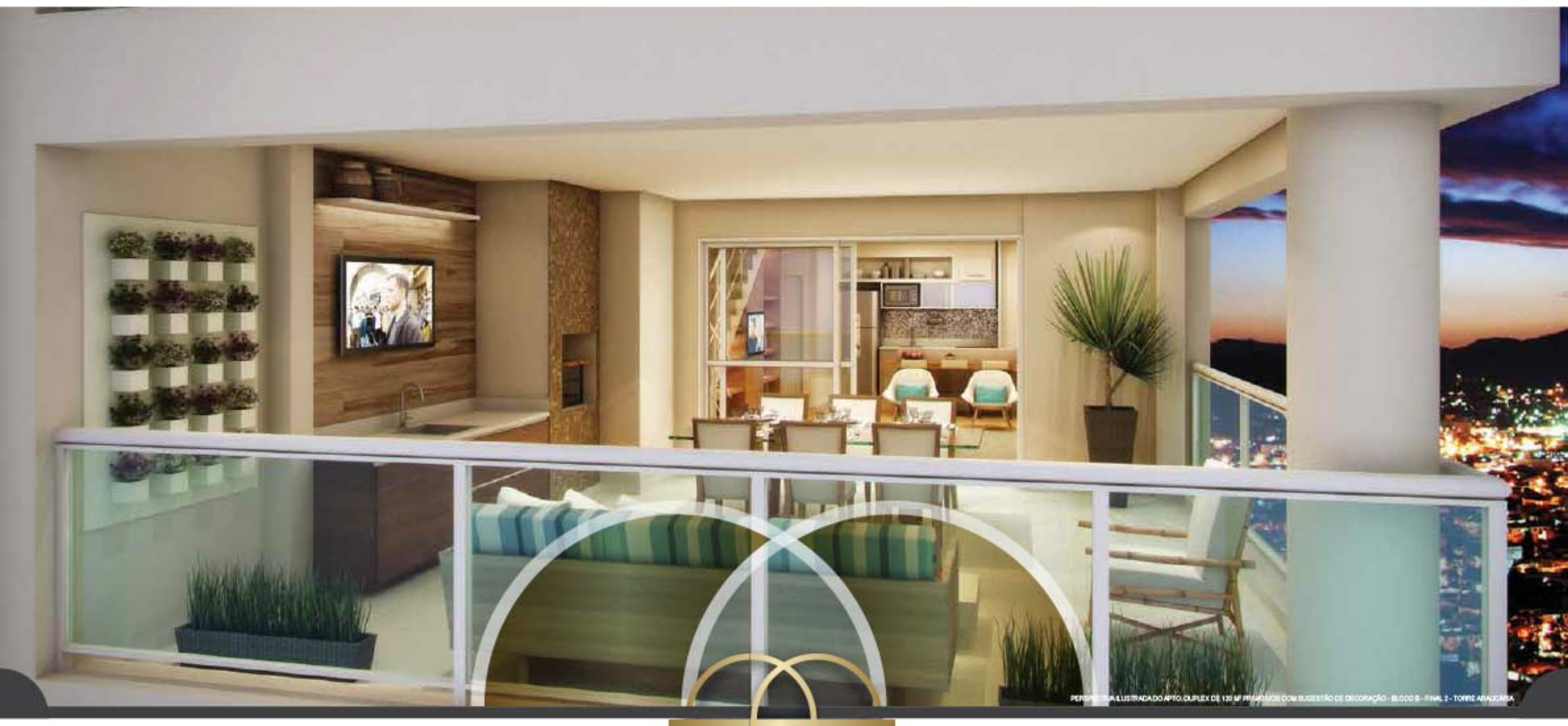
PERSPECTIVA ILUSTRADA DO APTO. DUPLEX DE 120 M 2 PRIVATIVOS COM SUGESTÃO DE DECORAÇÃO - BLOCO B - FINAL 2 - TORRE AVALICASA

O MAGNÍFICO APARTAMENTO DUPLEX É A REPRESENTAÇÃO PERFEITA DO ALTO PADRÃO E DE SUA NOVA VIDA.