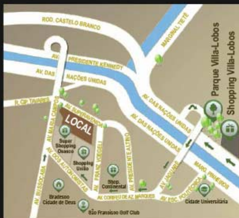
CROQUI DE LOCALIZAÇÃO SEM ESCALA