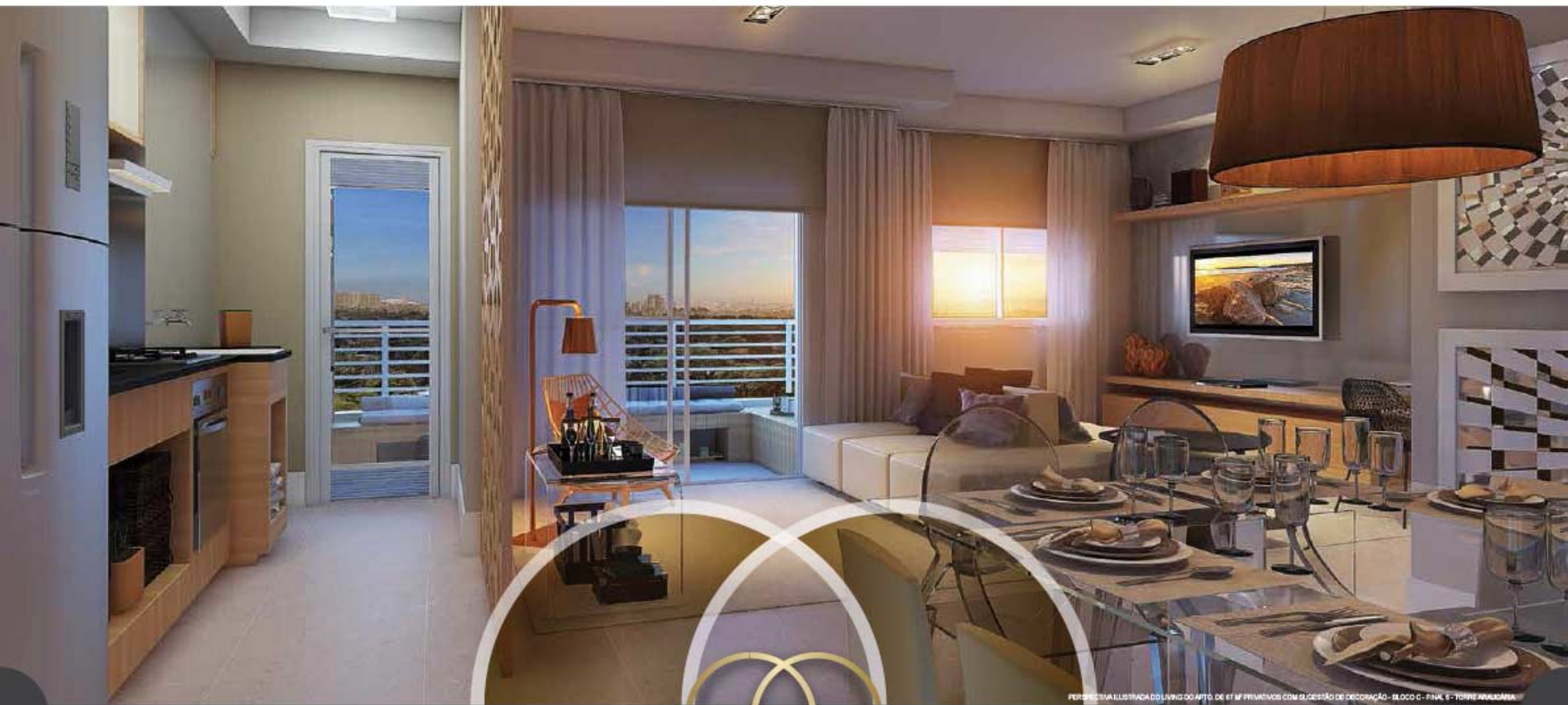
PERSPECTIVA ILUSTRADA DO LIVING DO APTO. DE 87 M 2 PRIVATIVOS COM SUGESTÃO DE DECORAÇÃO - BLOCO C - FINAL 6 - TORRE AVALCÁSA

NO AMPLO TERRAÇO INTEGRADO AO LIVING, O BEM-ESTAR GANHA UMA NOVA DIMENSÃO.