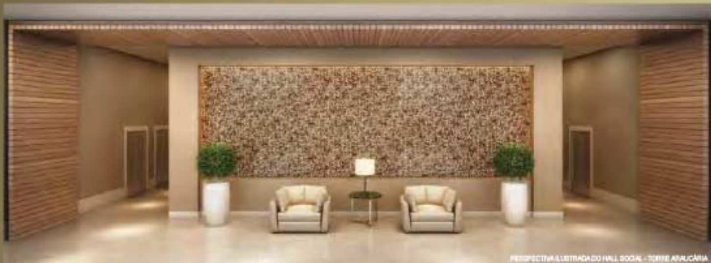
PERSPECTIVA ILUSTRADA DO HALL DOGA - TORRE APALCÁRIA