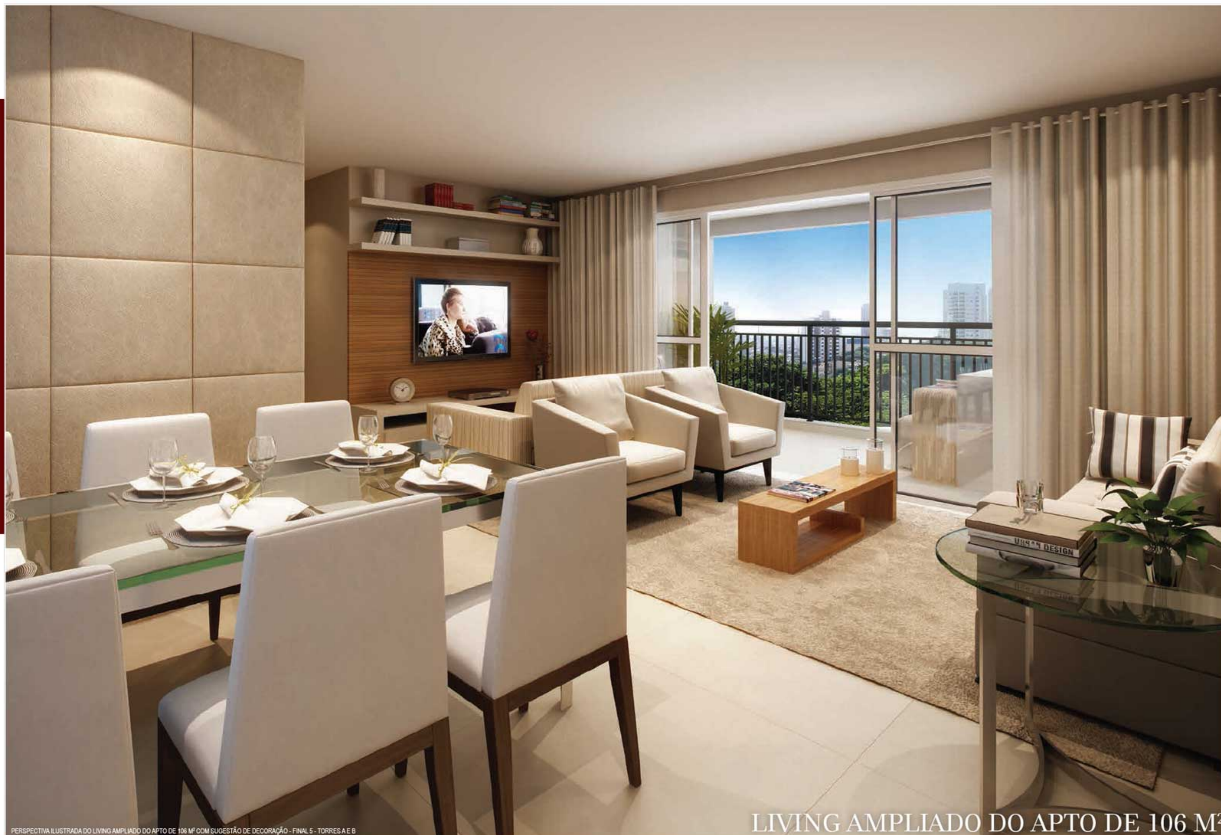
PERSPECTIVA ILUSTRADA DO LIVING AMPLIADO DO APTO DE 106 M 2 COM SUGESTÃO DE DECORAÇÃO - FINAL 9 - TORRES A E B

AMPLOS ESPAÇOS QUE DEFINEM UM NOVO CONCEITO DE MORADIA E BEM-ESTAR.