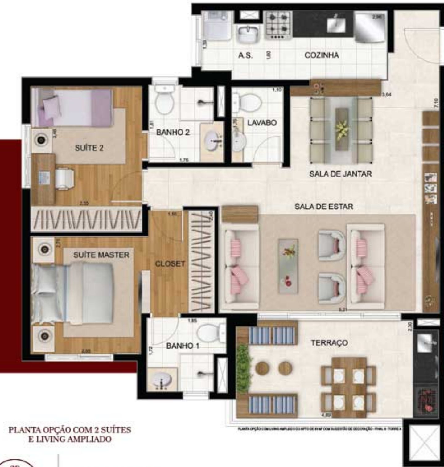
PLANTA OPÇÃO COM 2 SUÍTES E LIVING AMPLIADO