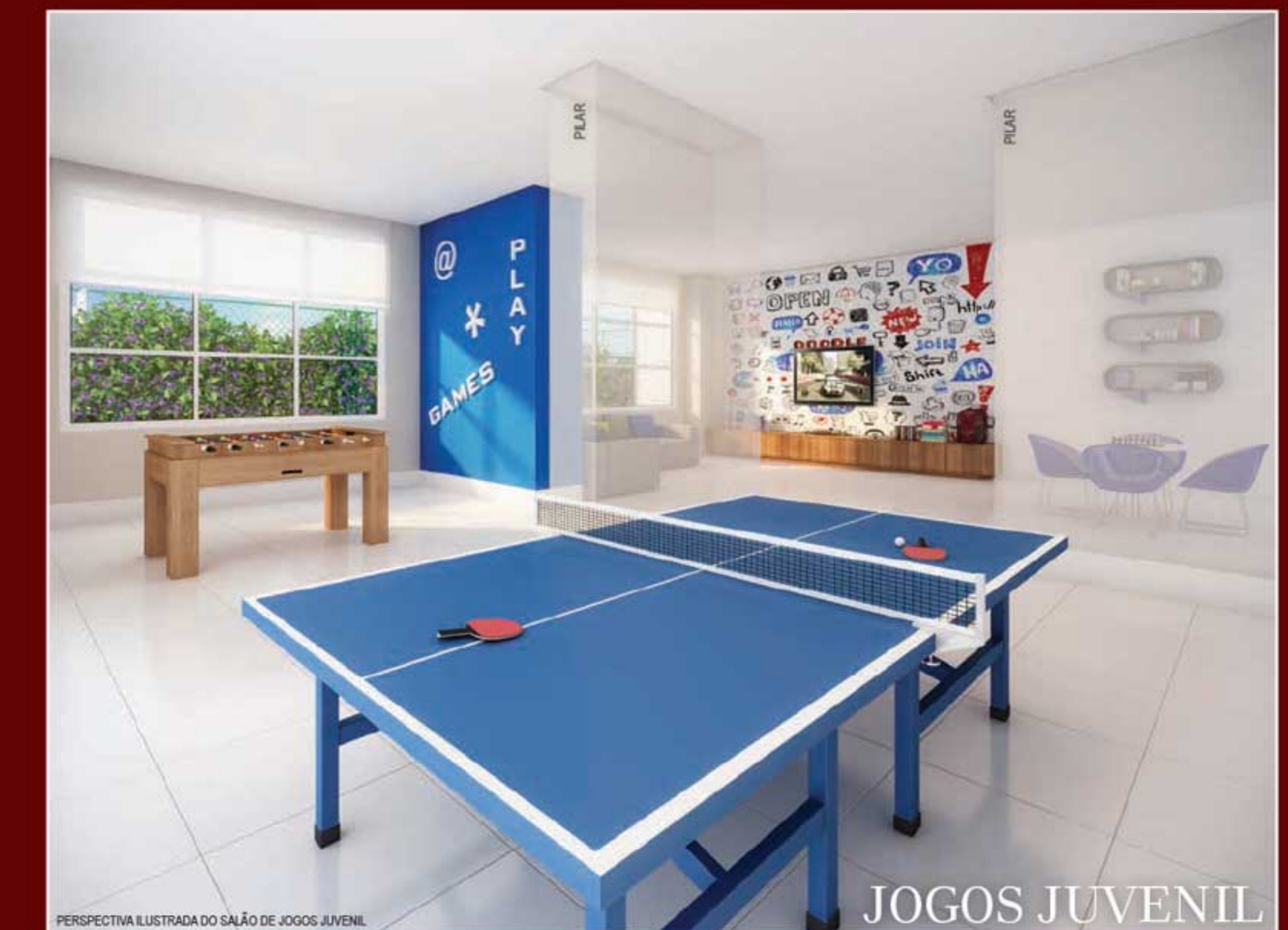
PERSPECTIVA ILUSTRADA DO SALÃO DE JOGOS JUVENIL