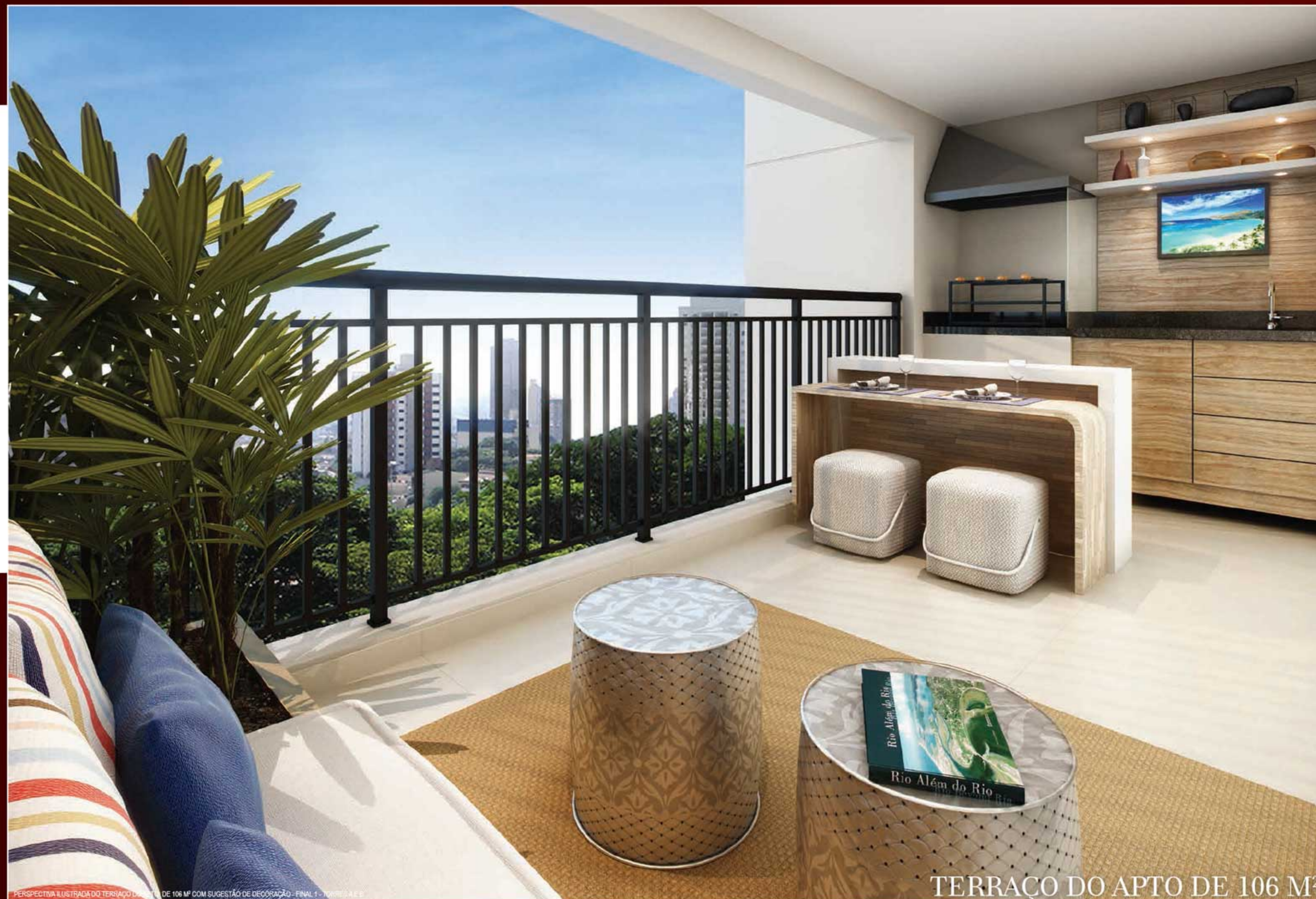
TERRAÇO DO APTO DE 106 M 2

REQUINTE E ACABAMENTO PERFEITO EM AMBIENTES IDEALIZADOS PARA UMA VIDA COM MAIS QUALIDADE.