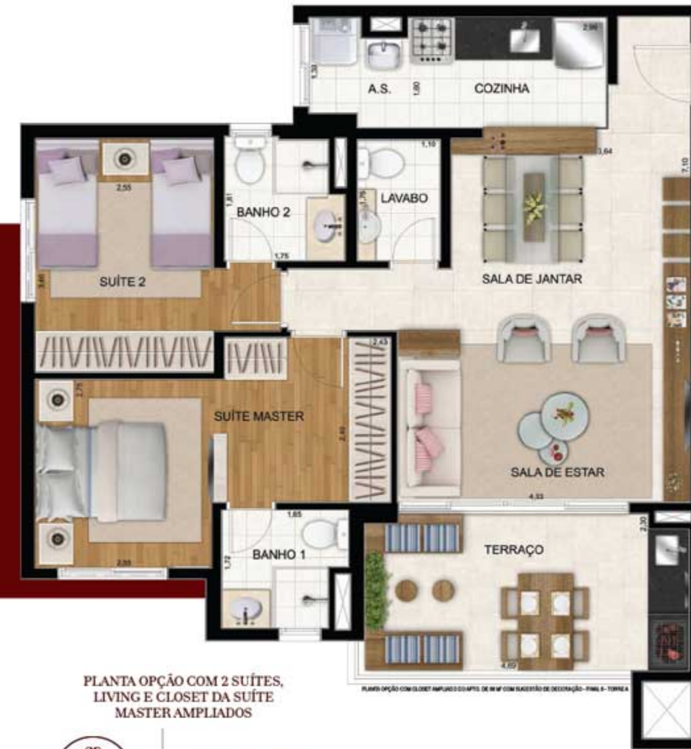
PLANTA OPÇÃO COM 2 SUÍTES, LIVING E CLOSET DA SUÍTE MASTER AMPLIADOS

NO ESPAÇOSO LIVING, A DIMENSÃO PERFEITA DA SUA NOVA VIDA.