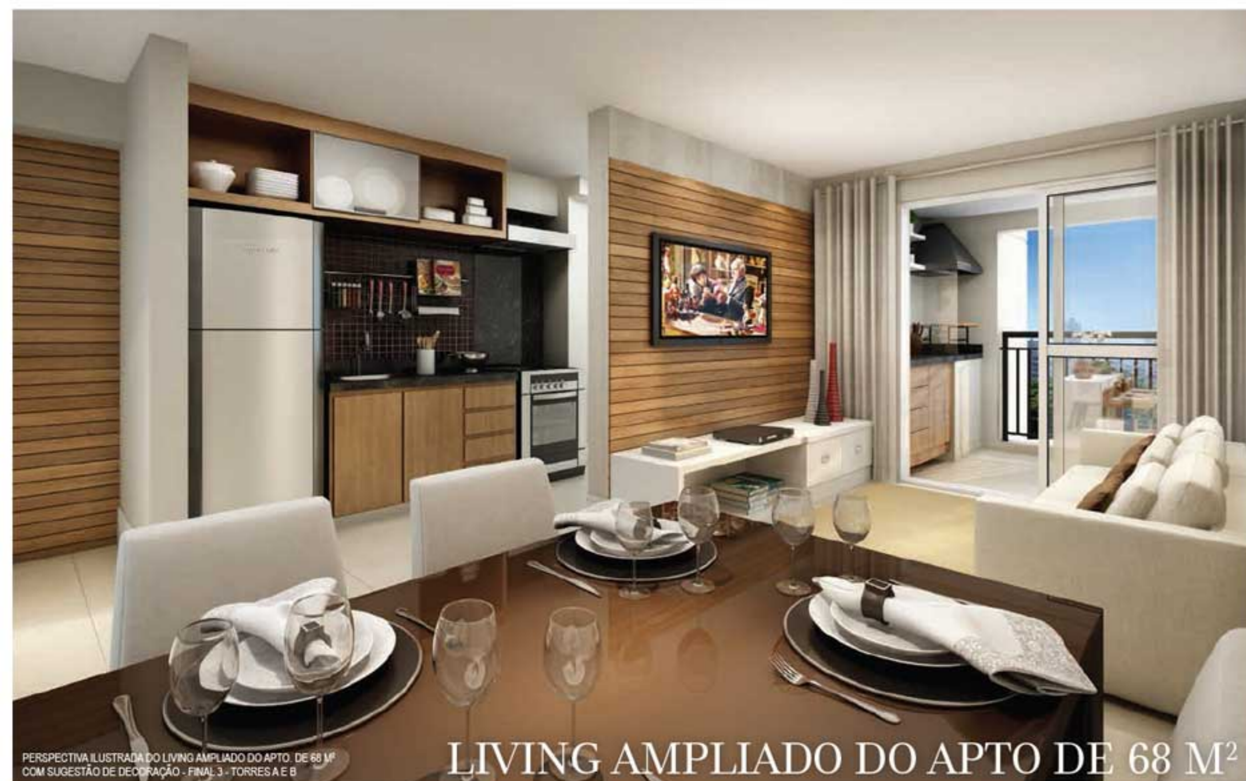
PERSPECTIVA ILUSTRADA DO LIVING AMPLIADO DO APTO. DE 68 M 2 COM SUGESTÃO DE DECORAÇÃO - FINAL 3 - TORRES A E B LIVING AMPLIADO DO APTO DE 68 M 2

ESPAÇOS DINÂMICOS E FLEXÍVEIS QUE ALIAM CONFORTO E SOFISTICAÇÃO.