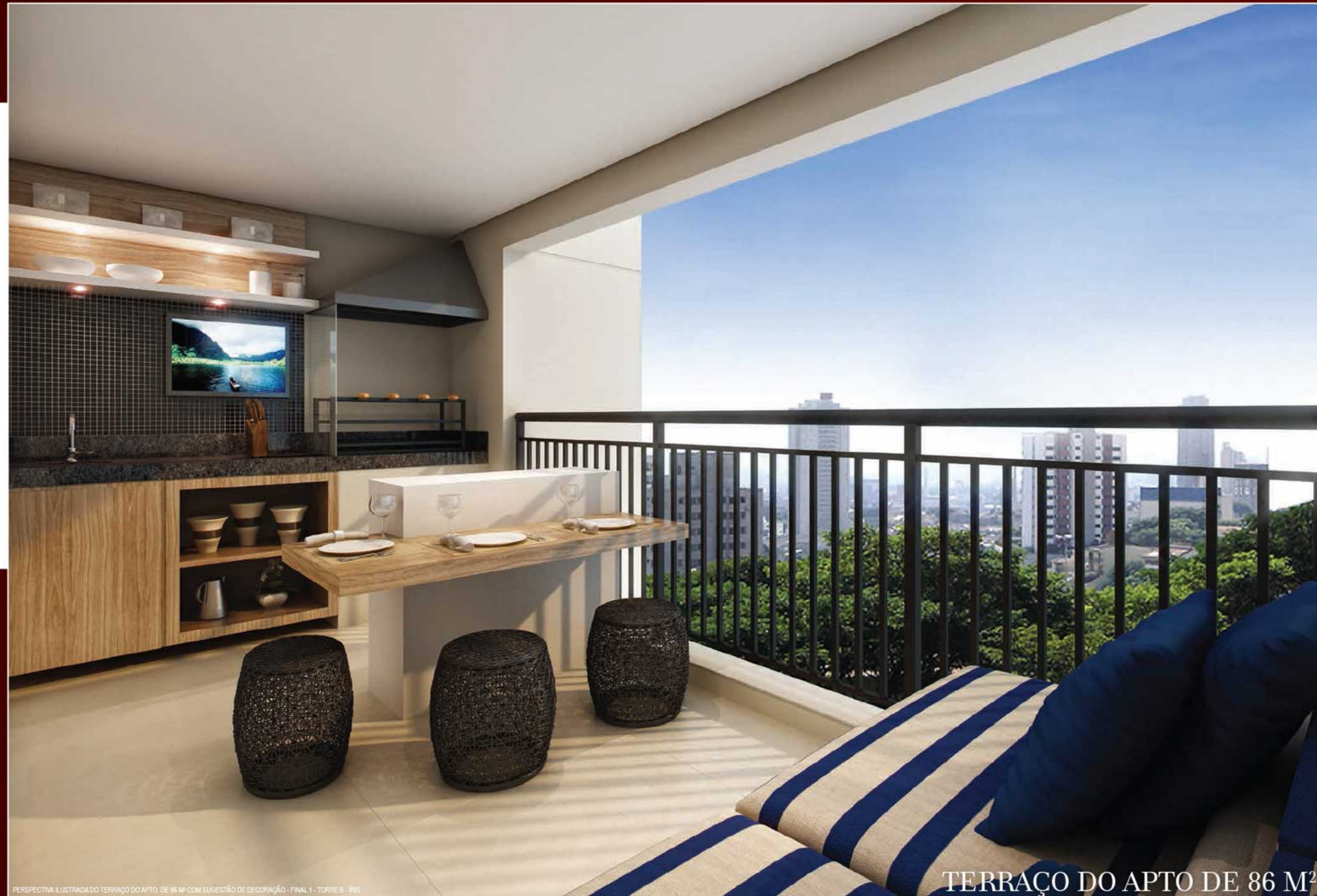
TERRAÇO DO APTO DE 86 M 2

UM AMPLO TERRAÇO PARA REUNIR A FAMÍLIA E OS AMIGOS.