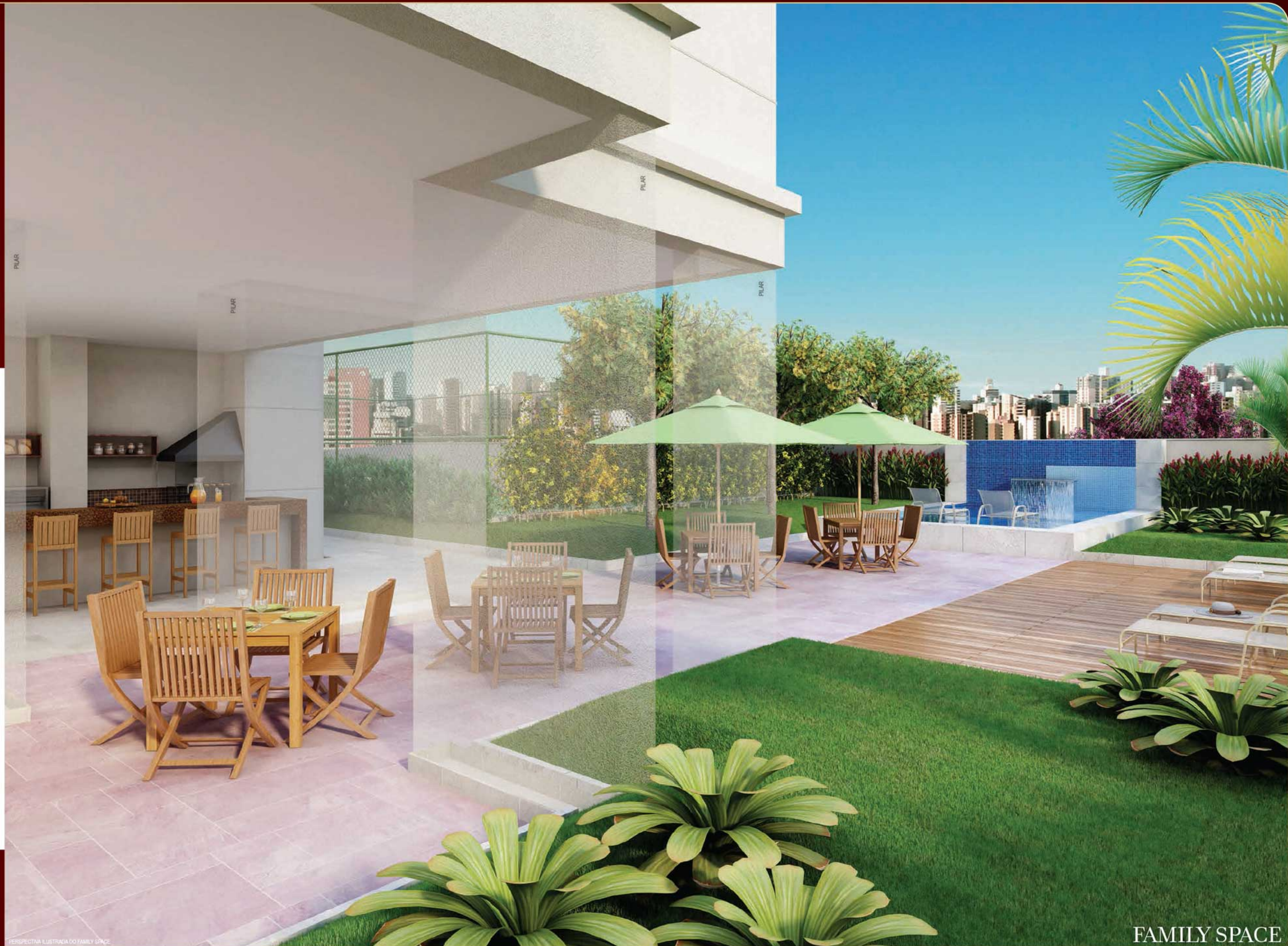
PERSPECTIVA ILUSTRADA DO FAMILY SPACE