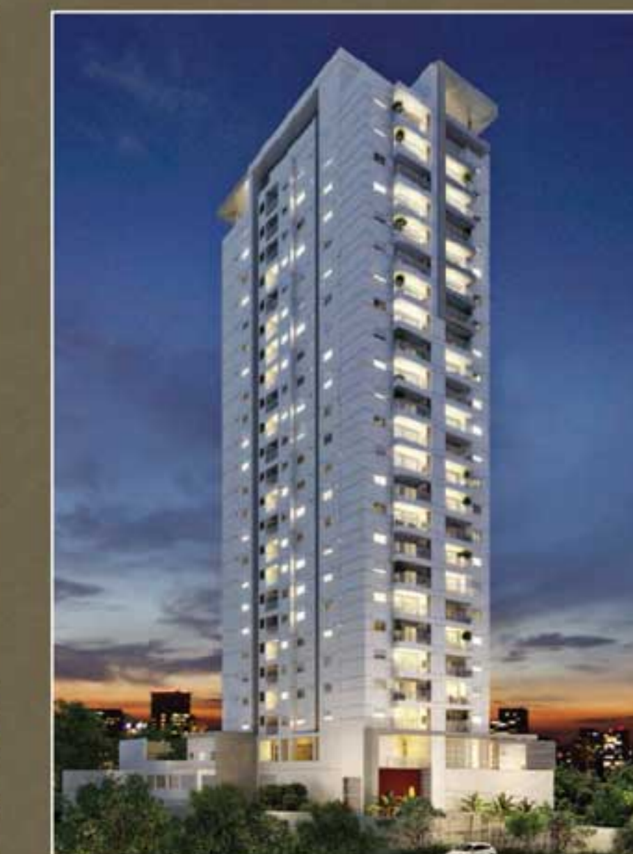
PERSPECTIVA ILUSTRADA DA FACADA