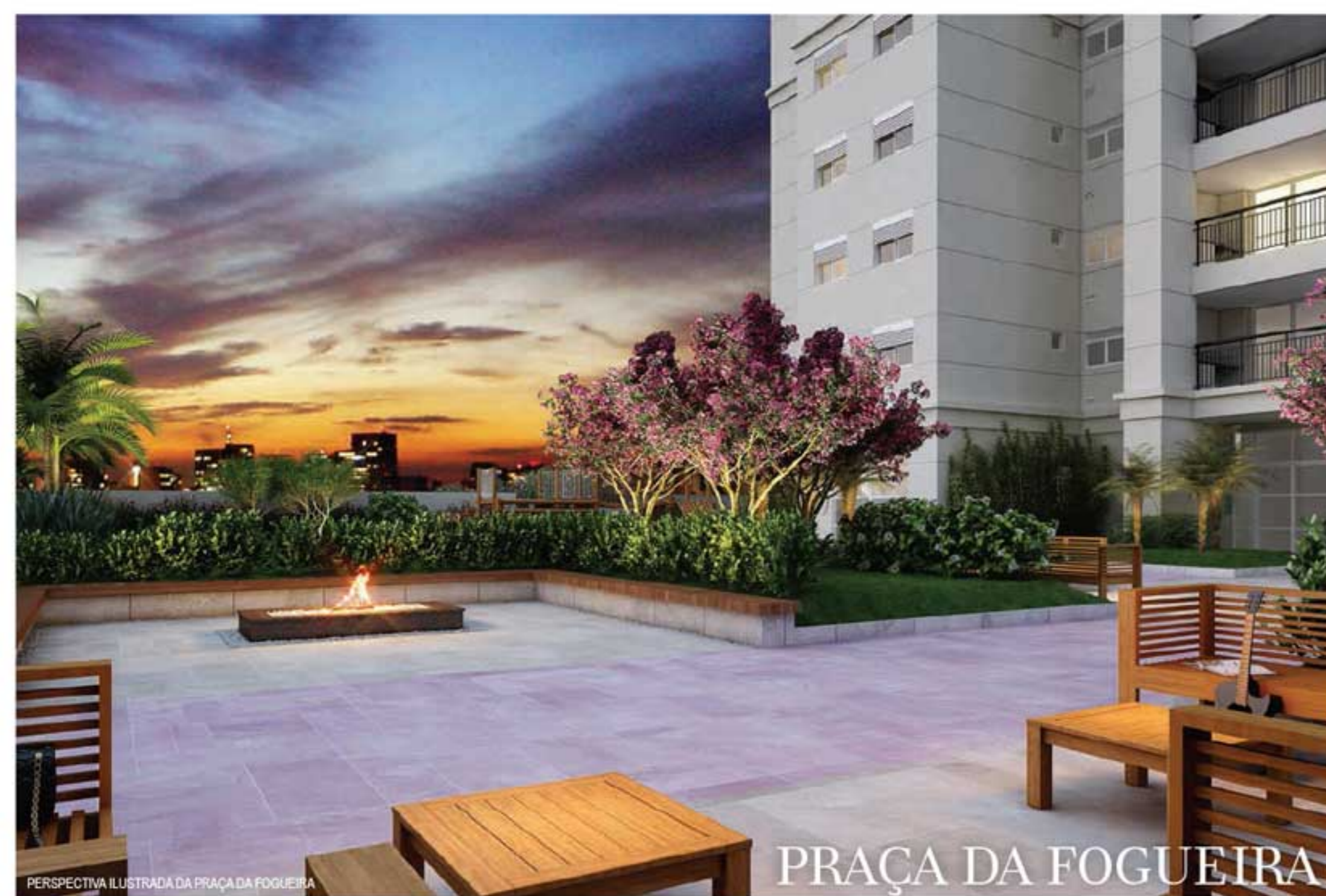
PERSPECTIVA ILUSTRADA DA PRAÇA DA FOGUEIRA

PARA OS MOMENTOS MAIS TRANQUILOS, PRAÇAS QUE SÃO VERDADEIROS OÁSIS DE SERENIDADE E CONTATO COM A NATUREZA.