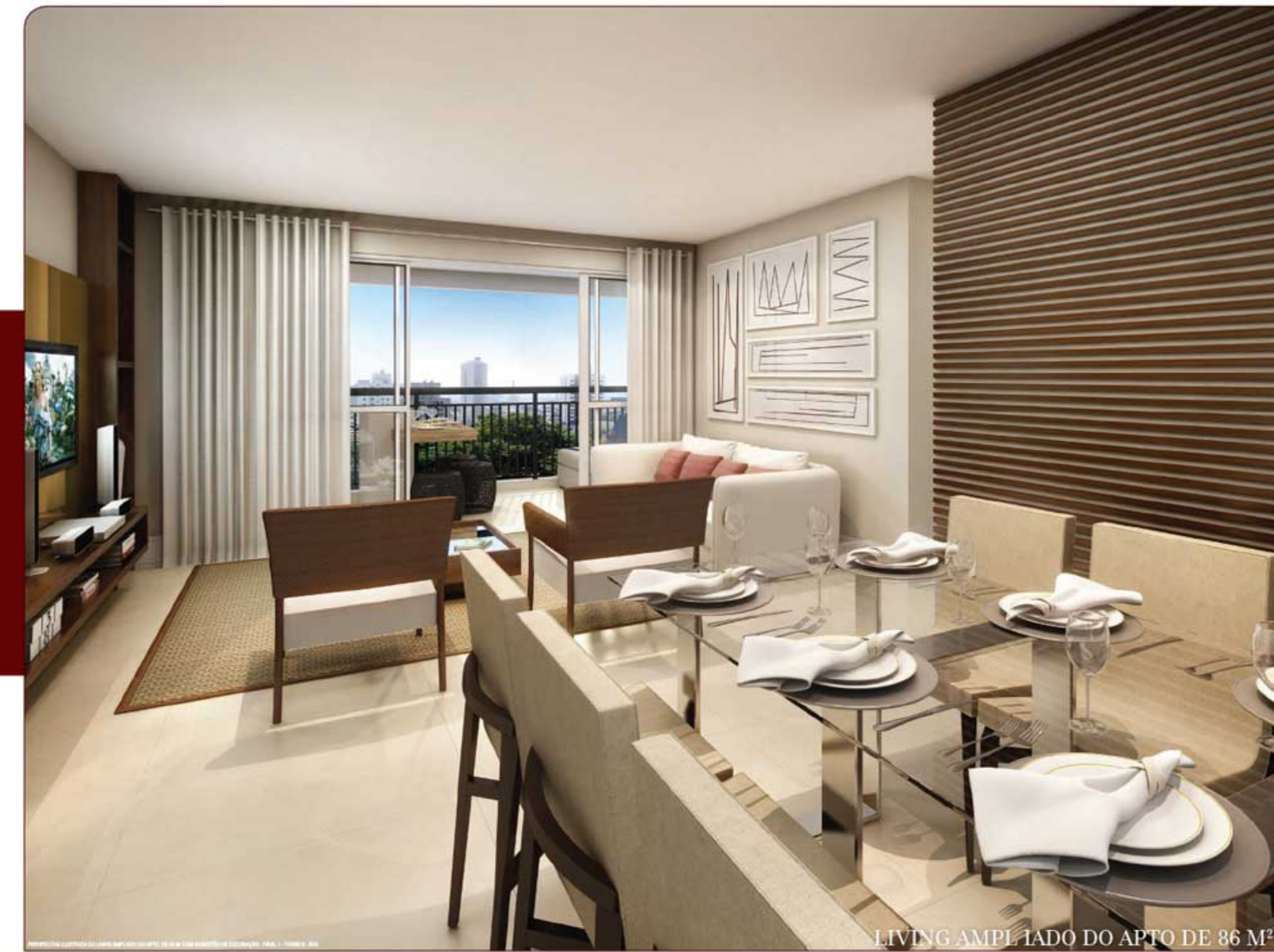
LIVING AMPLIADO DO APTO DE 86 M 2

NO ESPAÇOSO LIVING, A DIMENSÃO PERFEITA DA SUA NOVA VIDA.