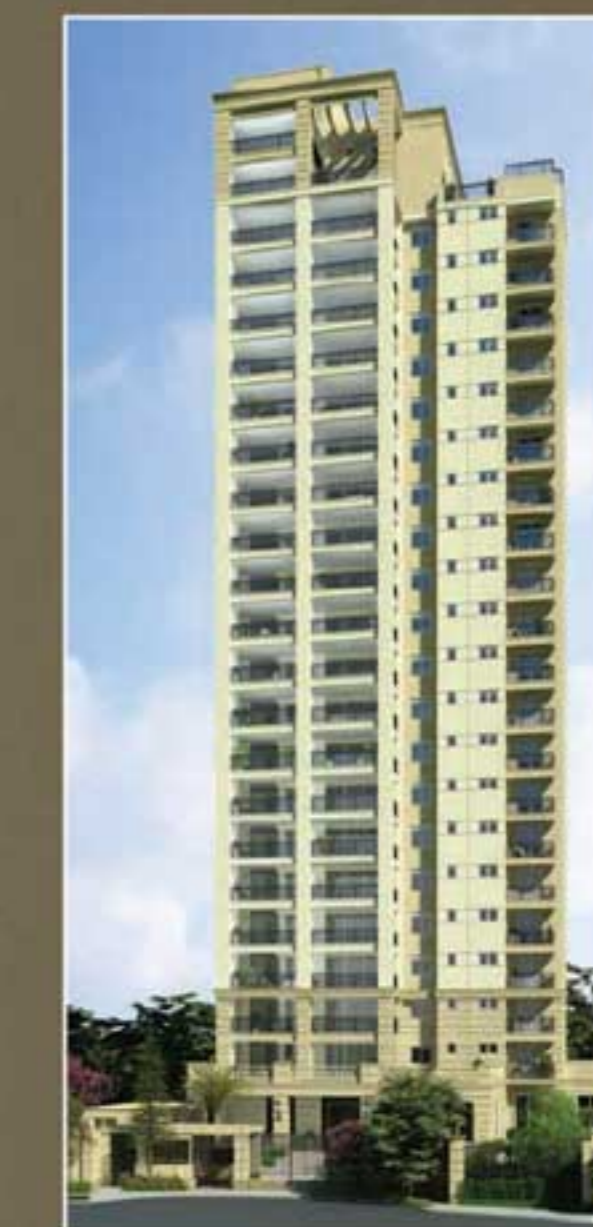
PERSPECTIVA ILUSTRADA DA FACADA