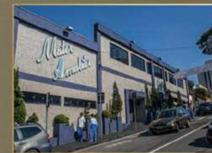
COLÉGIO MATER AMABILIS