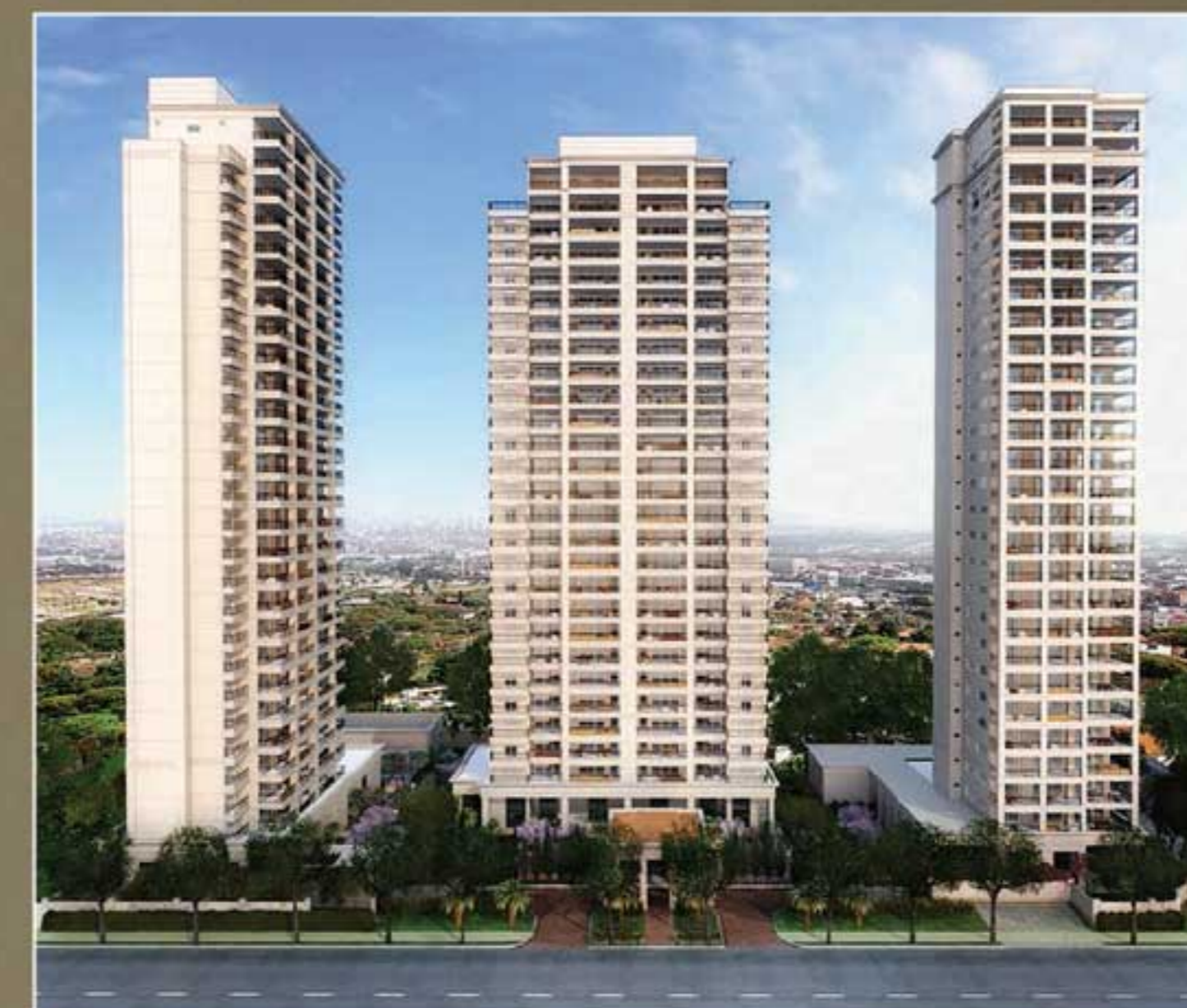
PERSPECTIVA ILUSTRADA DA FACADA