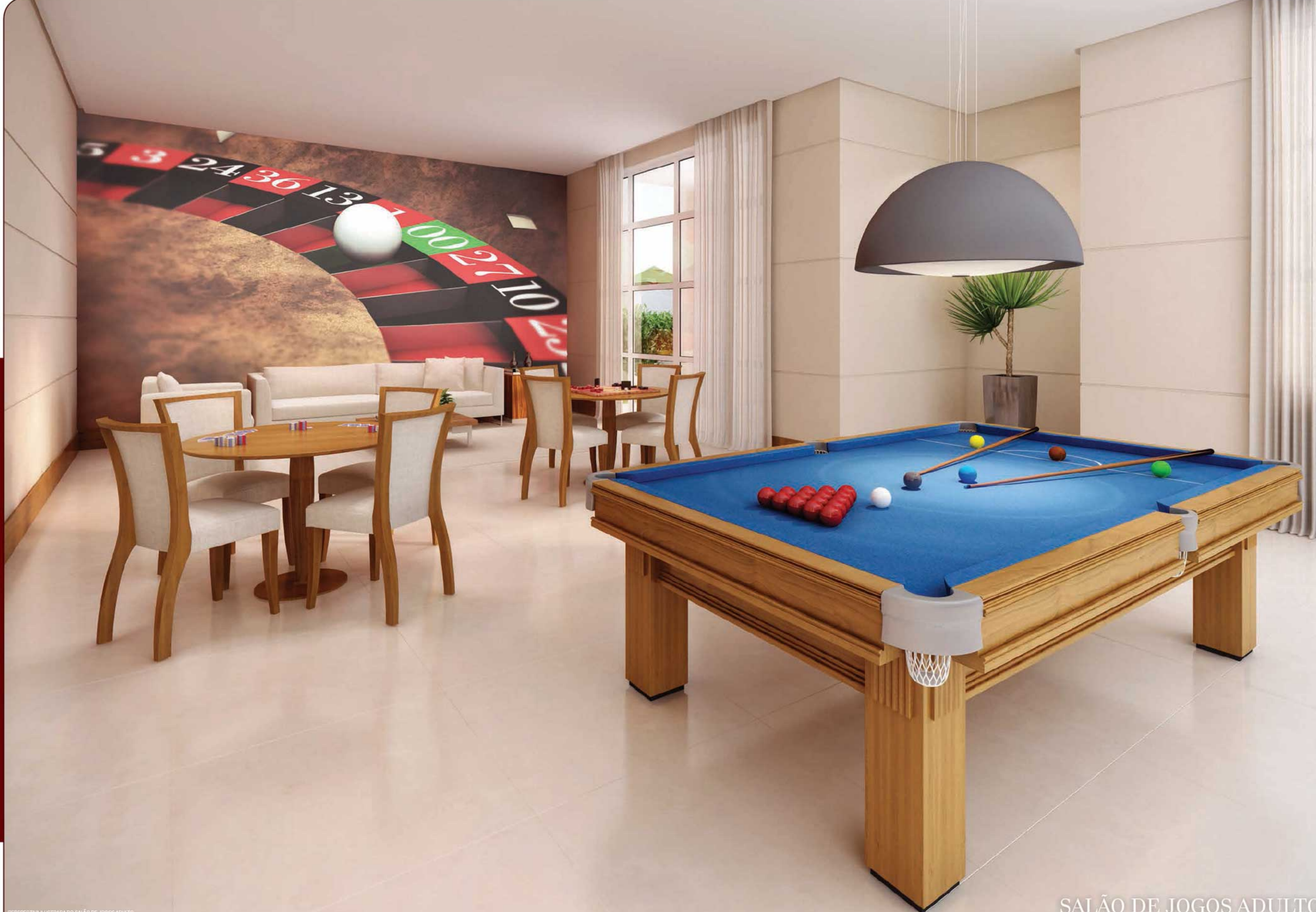
PERSPECTIVA ILUSTRADA DO SALÃO DE JOGOS ADULTO

LUGARES PERFEITOS PARA REUNIR OS AMIGOS E DESFRUTAR DE MUITO LAZER E DIVERSÃO.