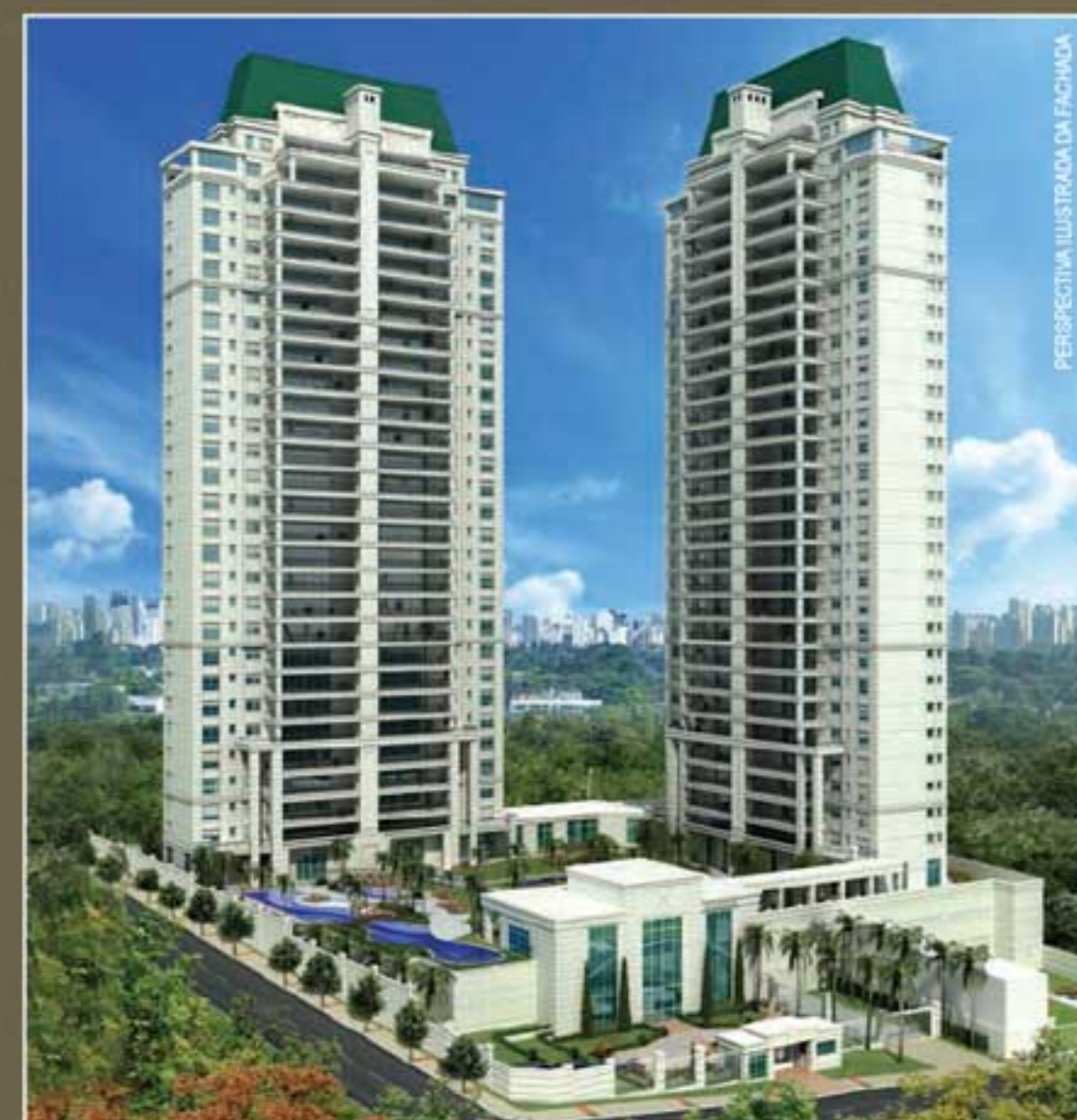
PERSPECTIVA ILUSTRADA DA FACADA