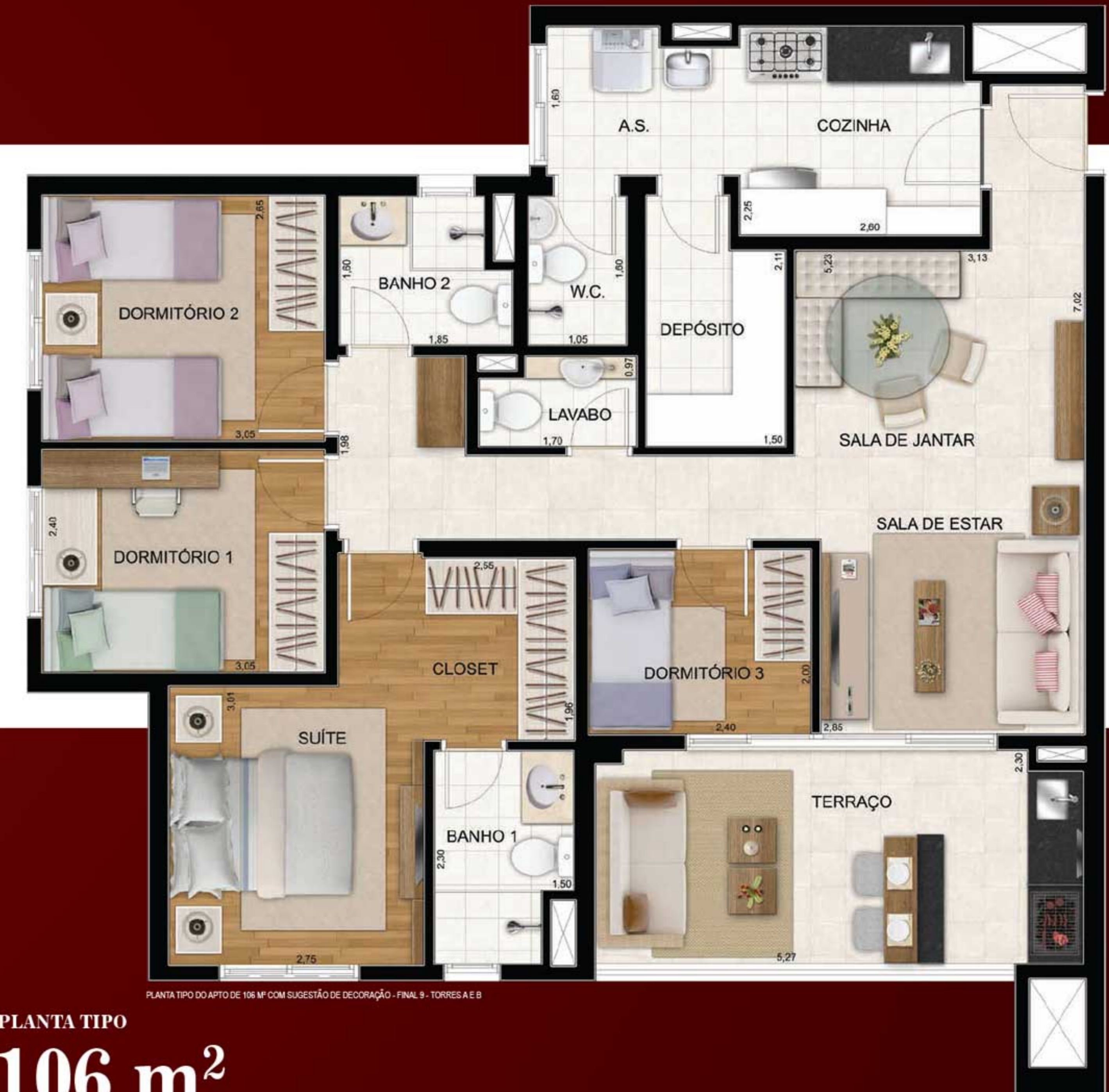
PLANTA TIPO DO APTO DE 106 M 2 COM SUGESTÃO DE DECORAÇÃO - FINAL 9 - TORRES A E B