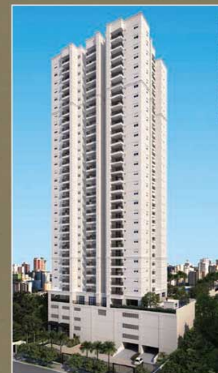
PERSPECTIVA ILUSTRADA DA FACADA