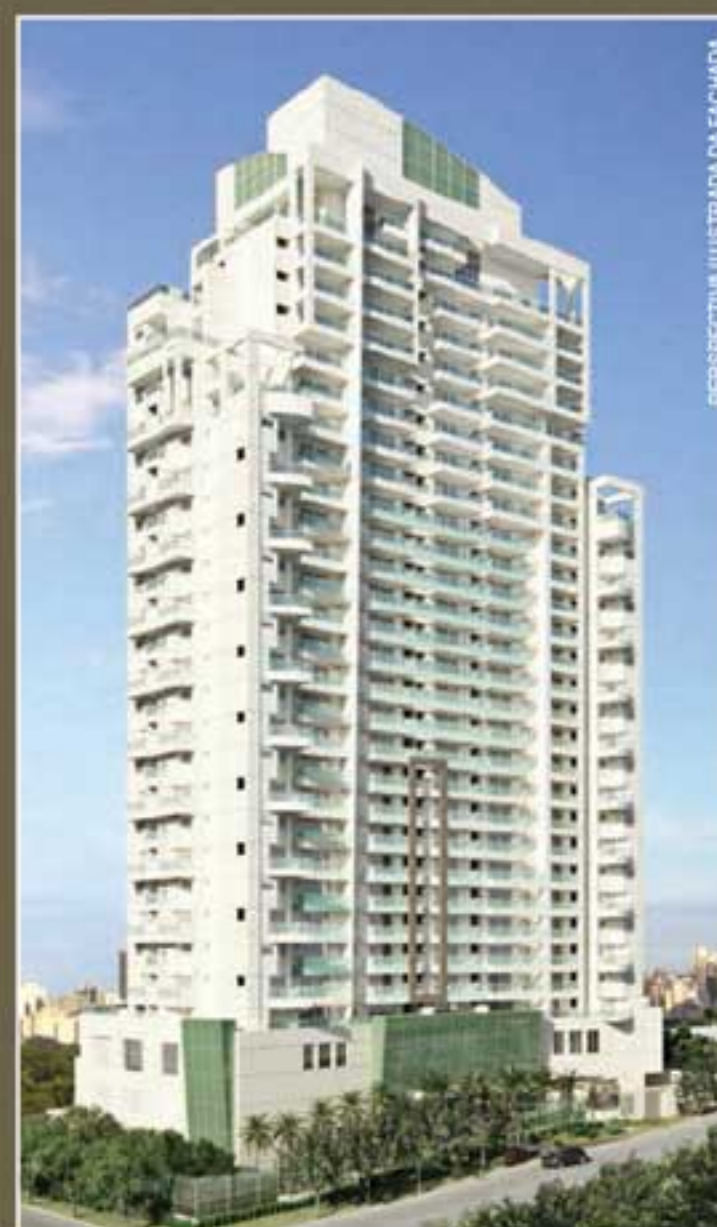
PERSPECTIVA ILUSTRADA DA FACADA