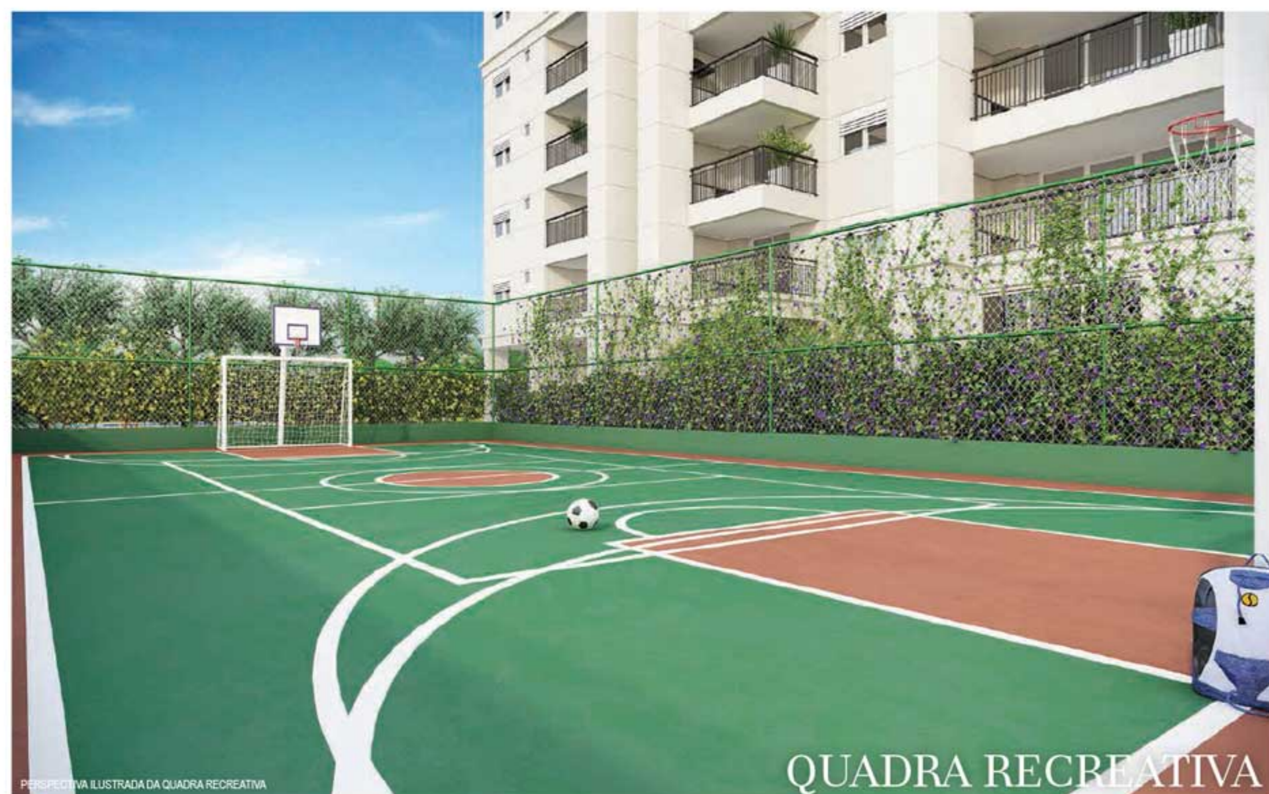
PERSPECTIVA ILUSTRADA DA QUADRA RECREATIVA

PREPARE-SE PARA EMOCIONANTES PARTIDAS NA QUADRA E MOMENTOS MARCANTES COM OS AMIGOS NO EXCLUSIVO FAMILY SPACE.