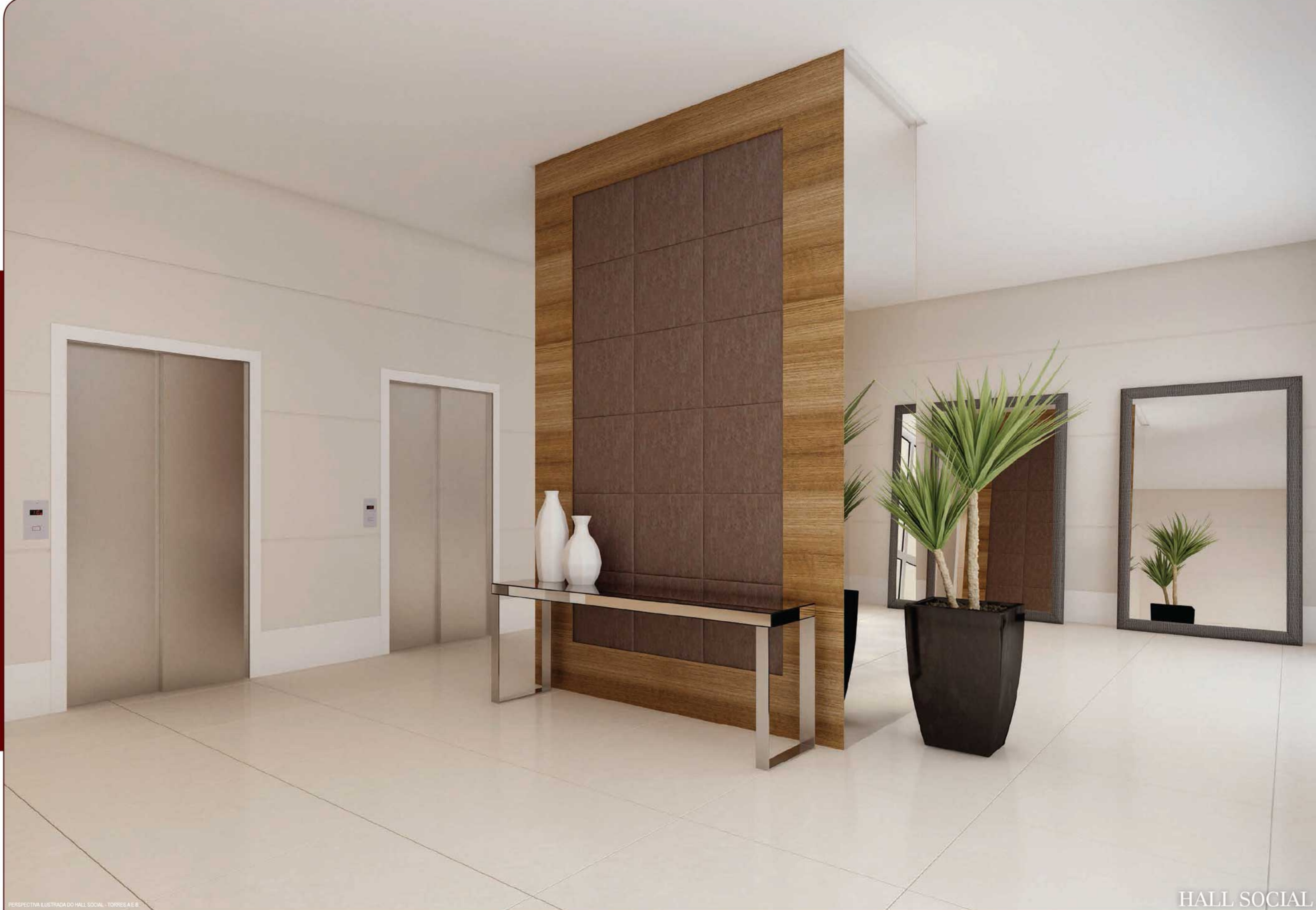
PERSPECTIVA ILUSTRADA DO HALL SOCIAL - TORRES A E B