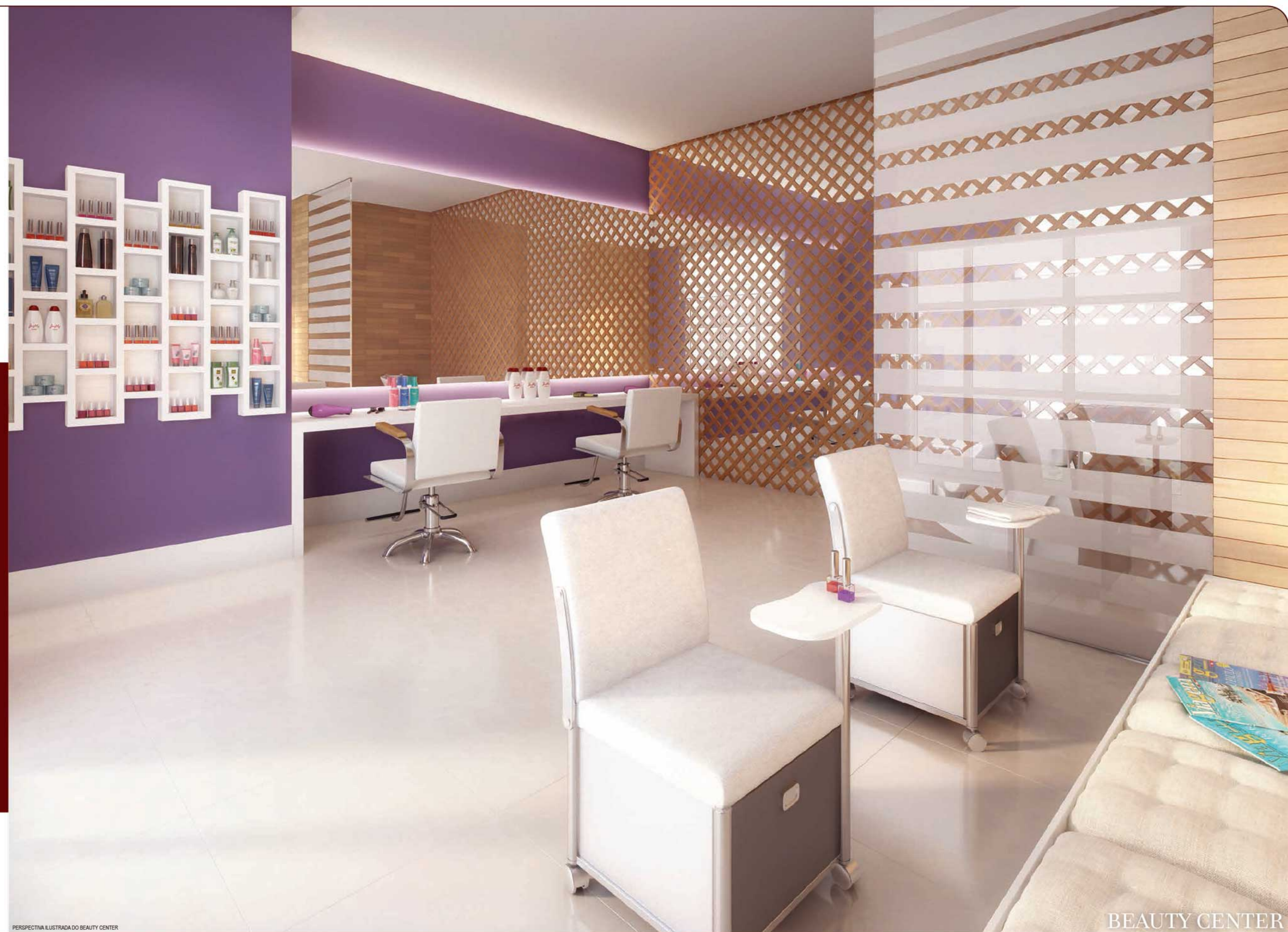
PERSPECTIVA ILUSTRADA DO BEAUTY CENTER