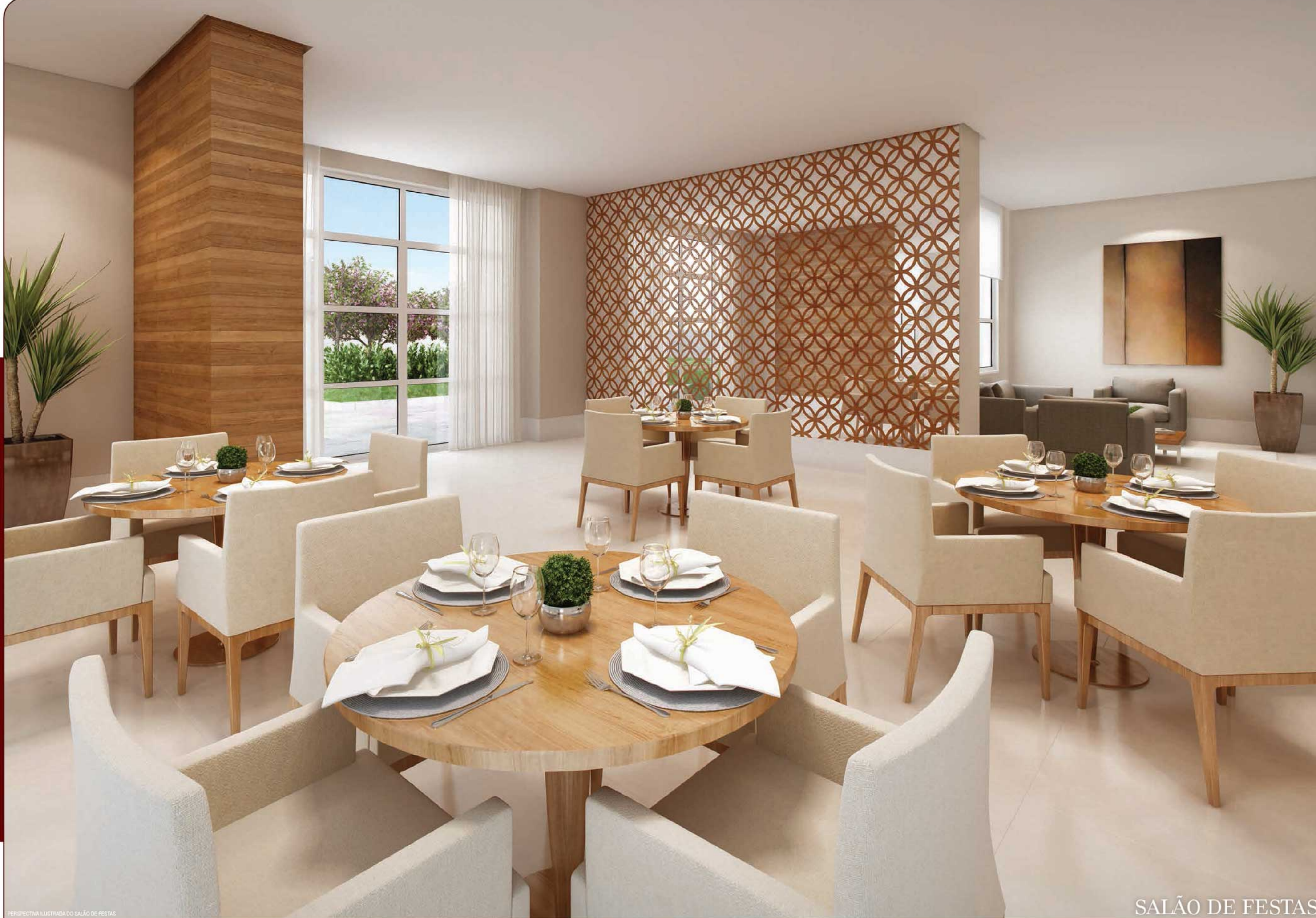
PERPECTIVA ILUSTRADA DO SALÃO DE FESTAS

ESPAÇOS PLANEJADOS PARA TORNAR SUAS MELHORES OCASIÕES COMPLETAS.