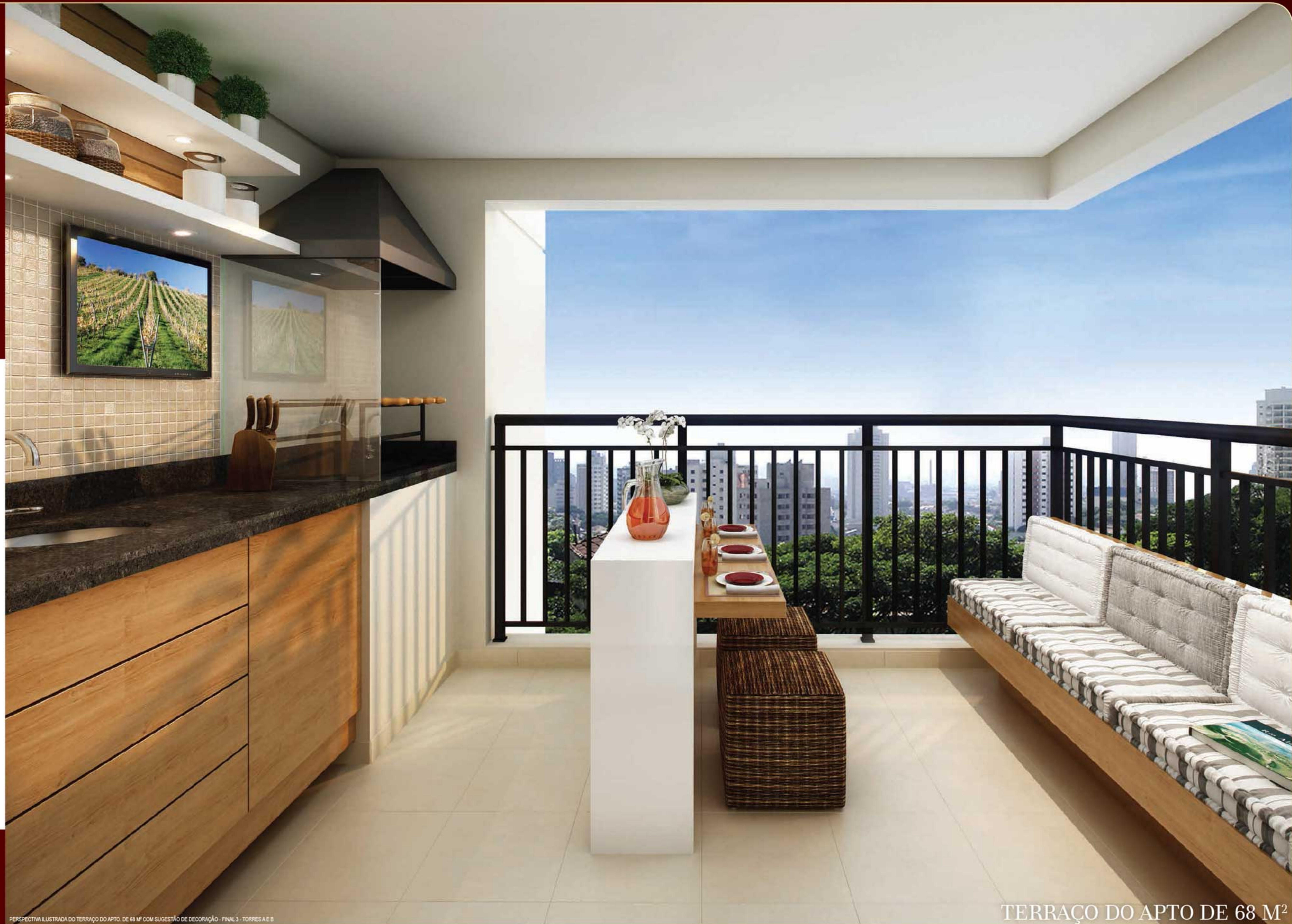
PERSPECTIVA ILUSTRADA DO TERRAÇO DO APTO. DE 68 M 2 COM SUGESTÃO DE DECORAÇÃO - FINAL 3 - TORRES A E B