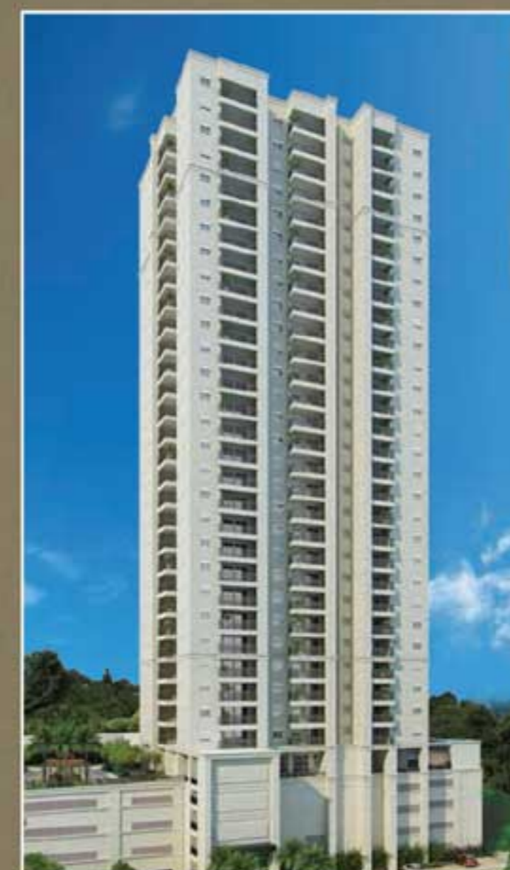
PERSPECTIVA ILUSTRADA DA FACADA