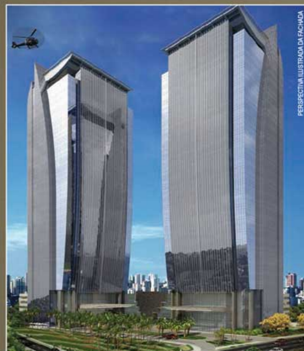
PERSPECTIVA ILUSTRADA DA FACADA