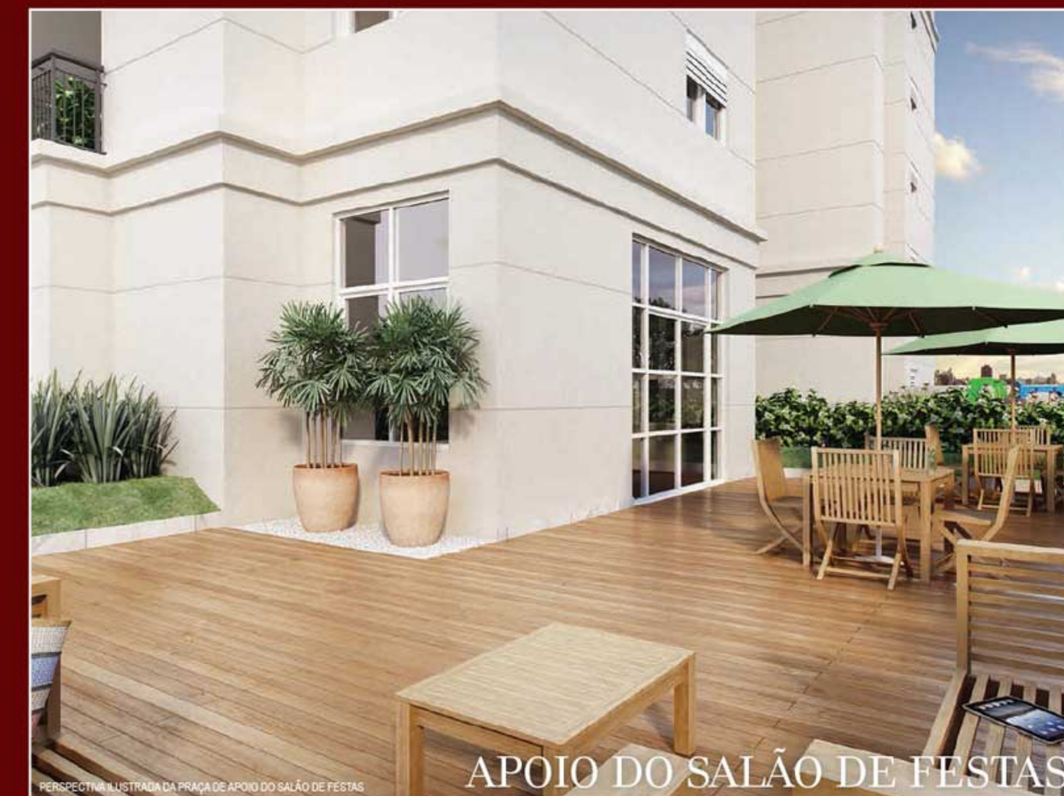
PERPECTIVA ILUSTRADA DA PRAÇA DE APOIO DO SALÃO DE FESTAS