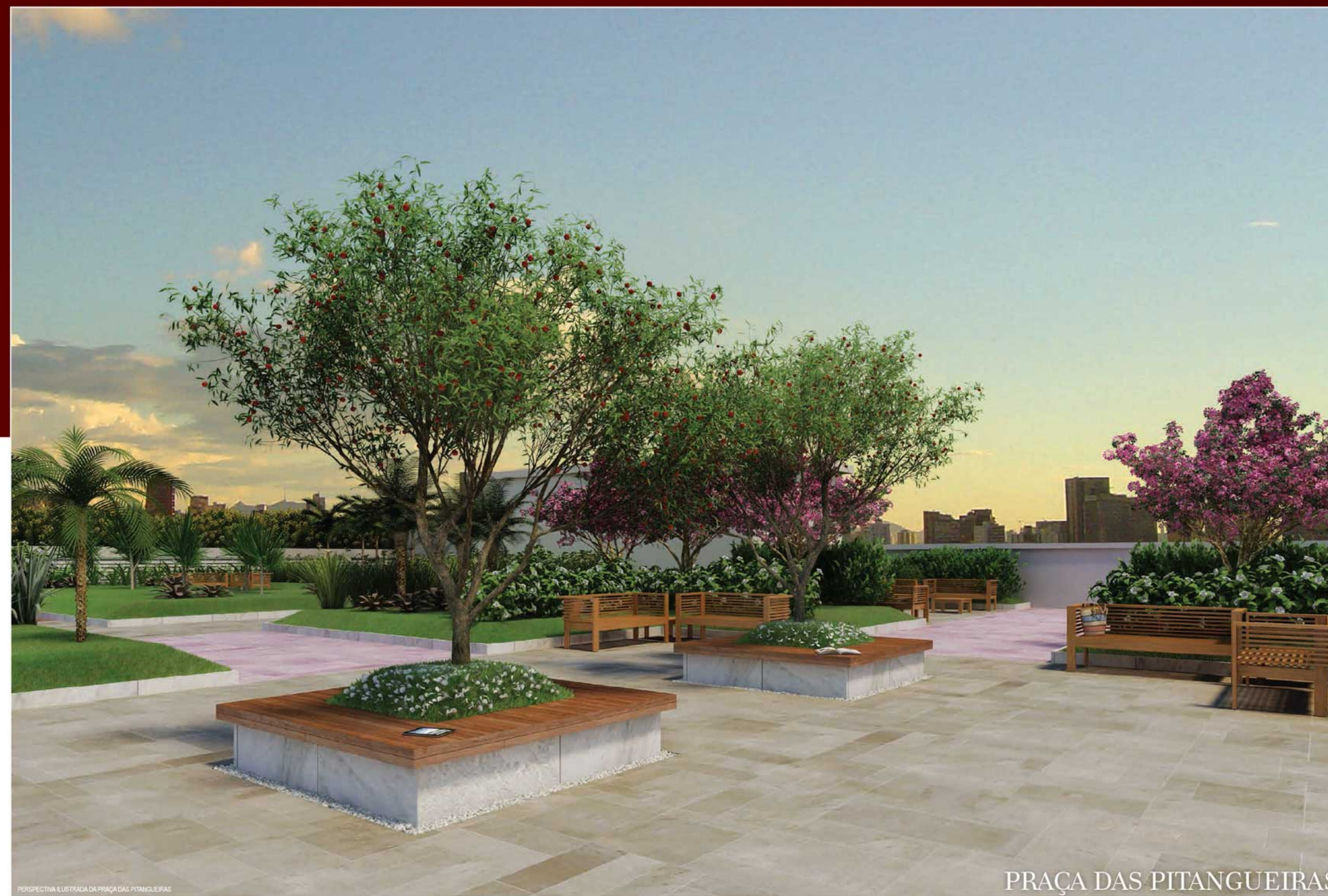
PERSPECTIVA ILUSTRADA DA PRAÇA DAS PITANGUEIRAS