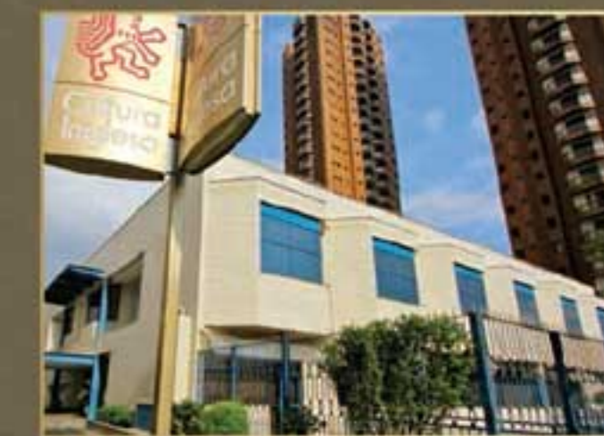
CULTURA INGLESA - ESCOLA DE IDIOMAS