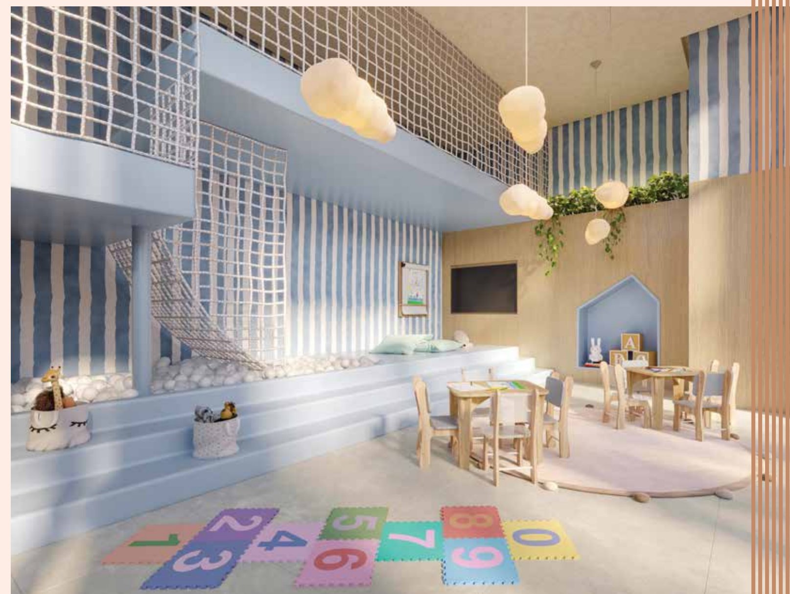
BRINQUEDOTECA | PERSPECTIVA ILUSTRADA