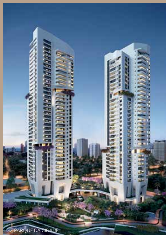
EZ PARQUE DA CIDADE