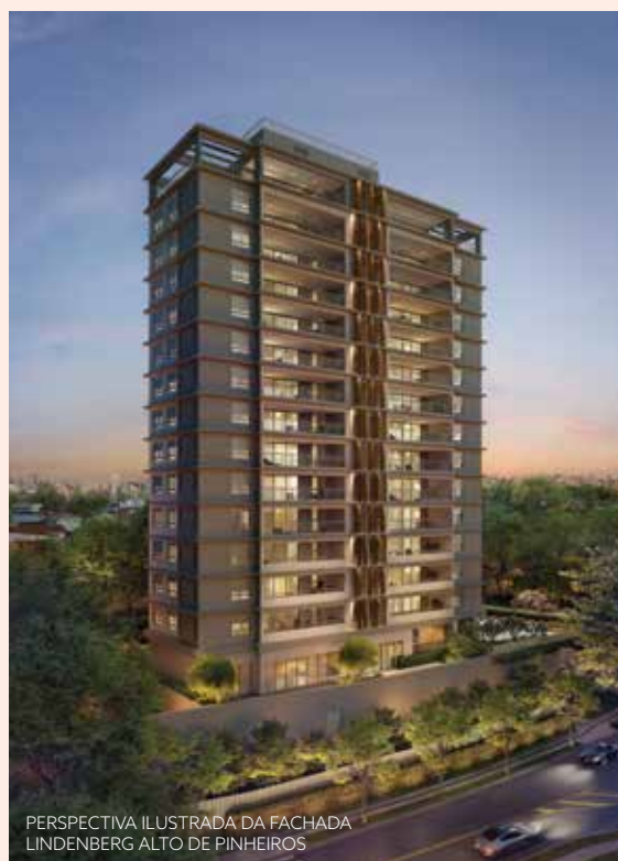
PERSPECTIVA ILUSTRADA DA FACHADA LINDENBERG ALTO DE PINHEIROS