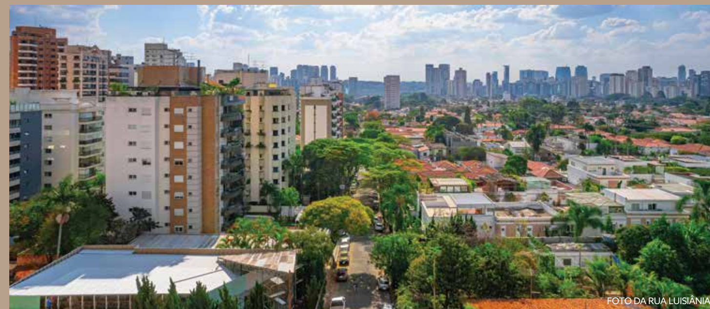
FOTO DA RUA LUISIÂNIA

O AUTÊNTICO BROOKLIN. R. LUISIÂNIA X AV. PORTUGAL