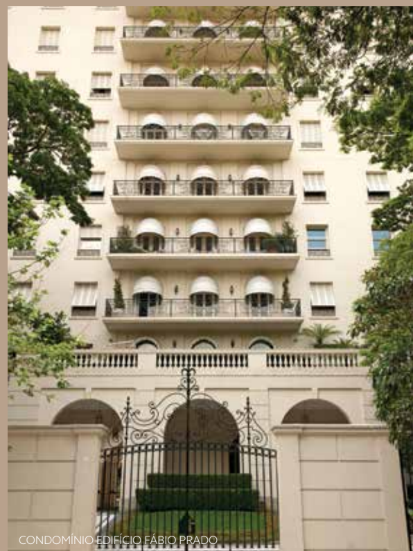
CONDOMÍNIO EDIFÍCIO FÁBIO PRADO