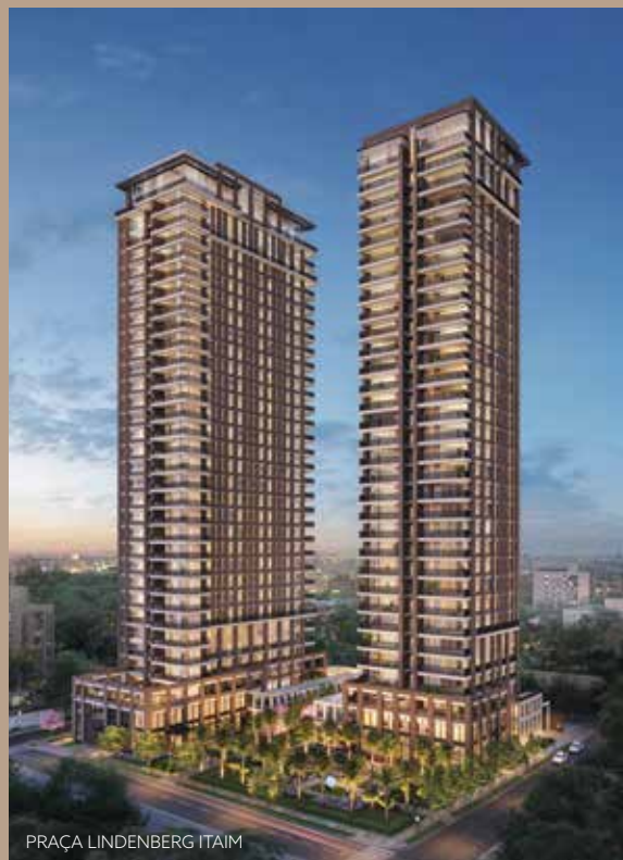
PRAÇA LINDENBERG ITAIM