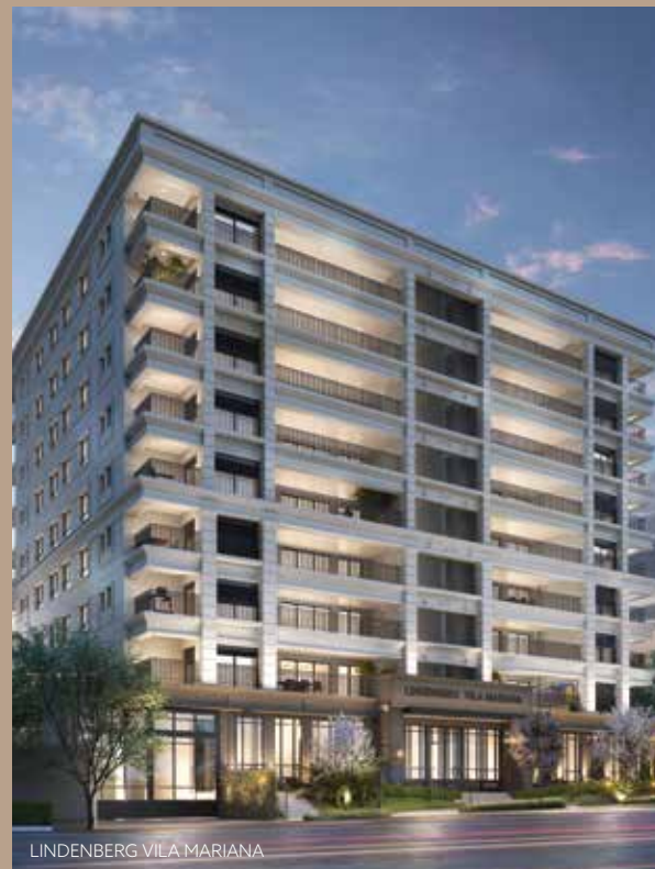
LINDENBERG VILA MARIANA