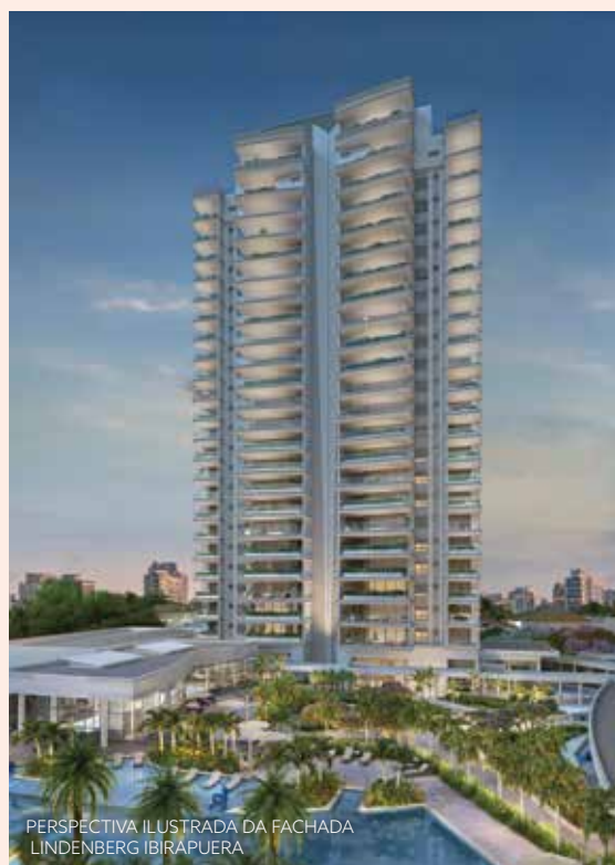
PERSPECTIVA ILUSTRADA DA FACHADA LINDENBERG IBIRAPUERA