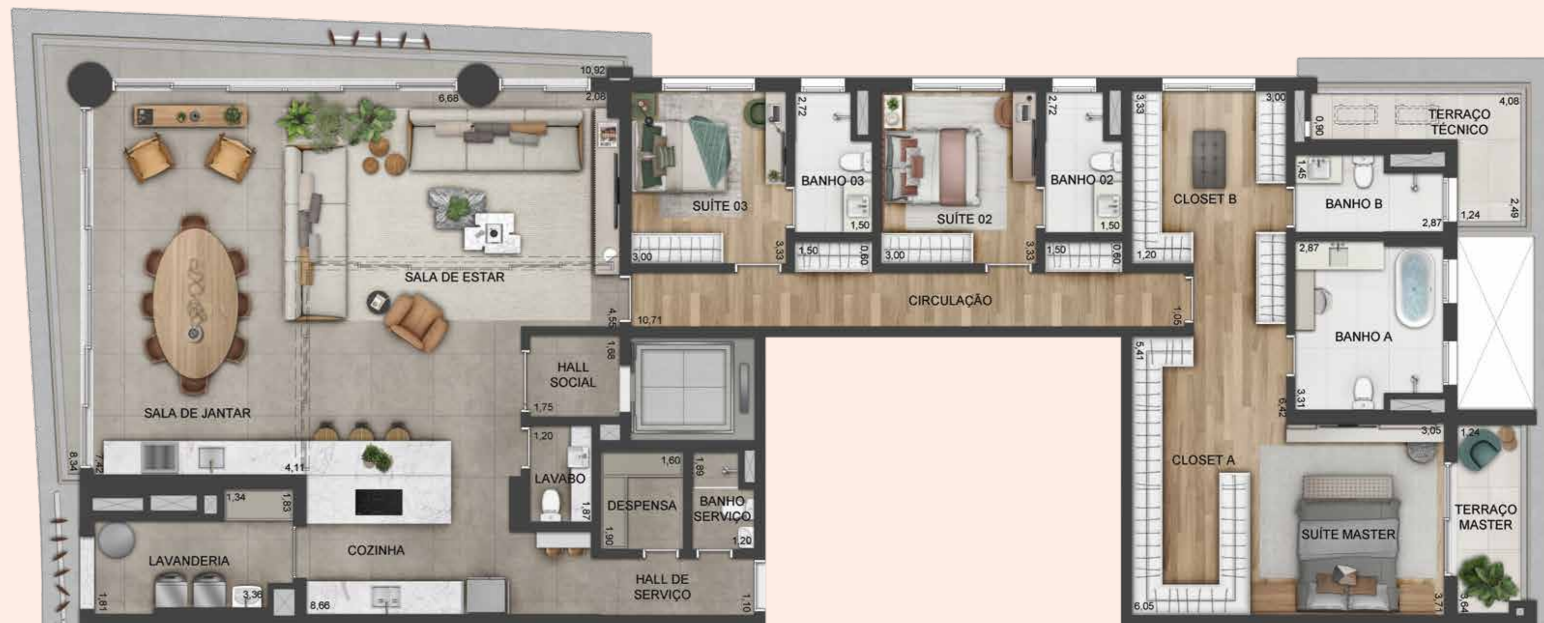
PLANTA OPÇÃO | 261 M 2 | 3 SUÍTES

SUGESTÃO DE DECORAÇÃO. EVENTUAIS ADEQUAÇÕES NAS INSTALAÇÕES ELÉTRICAS OU HIDRÁULICAS SERÃO POR CONTA DO CLIENTE. QUALQUER MODIFICAÇÃO NO APARTAMENTO QUE IMPLIQUE NA ALTERAÇÃO DO PROJETO QUE NÃO ESTEJA ESPECIFICADA NA CONVENÇÃO DE CONDOMÍNIO DEVERÁ SER APROVADA EM ASSEMBLEIA. PLANTA COM FECHAMENTO DE TERRAÇO NÃO INCLUSA NO MEMORIAL DESCRITIVO PADRÃO.