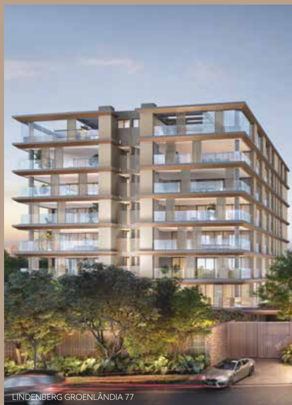
LINDENBERG GROENLÂNDIA 77