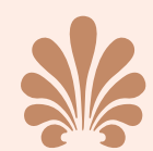
PLAYGROUND | PERSPECTIVA ILUSTRADA